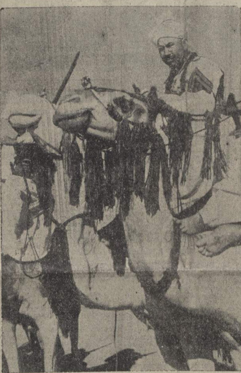
Reparto libico in attesa dell'ordine di marcia

MADRID, 30 sera Il Ministro degli Esteri ha ricevuto l'Ambasciatore d'Italia e lo ha intrattenuto a lungo colloquio.