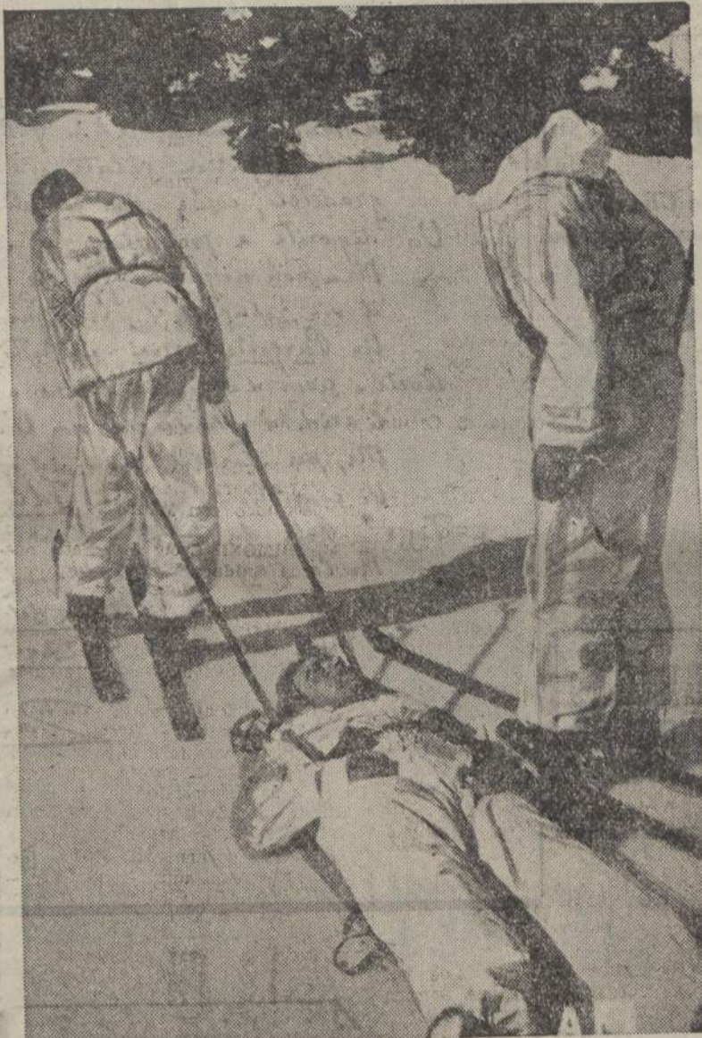
Durante questi mesi invernali le truppe della Svizzera neutrale si esercitano in speciali addestramenti

STOCOLMA, 24 sera. Per cause non ancora accertate il piroscafo finlandese «Inga» ha avuto una collisione con il piroscafo danese «Silkeborg» nel Mar Baltico. L'Inga, che stazza 3100 tonnellate, ha riportato tali danni che è affondato quasi immediatamente. L'equipaggio ha potuto salvarsi.