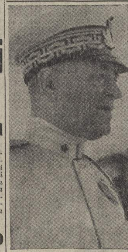
L'ammiraglio Campioni Sottocapo di Stato Maggiore della Marina