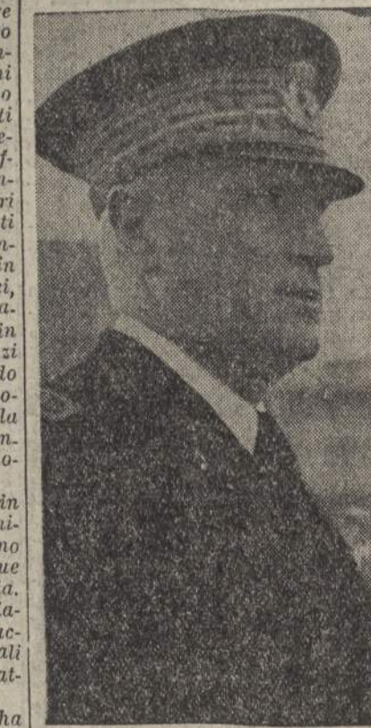
L'ammiraglio Jachino Comandante delle Forze navali in mare