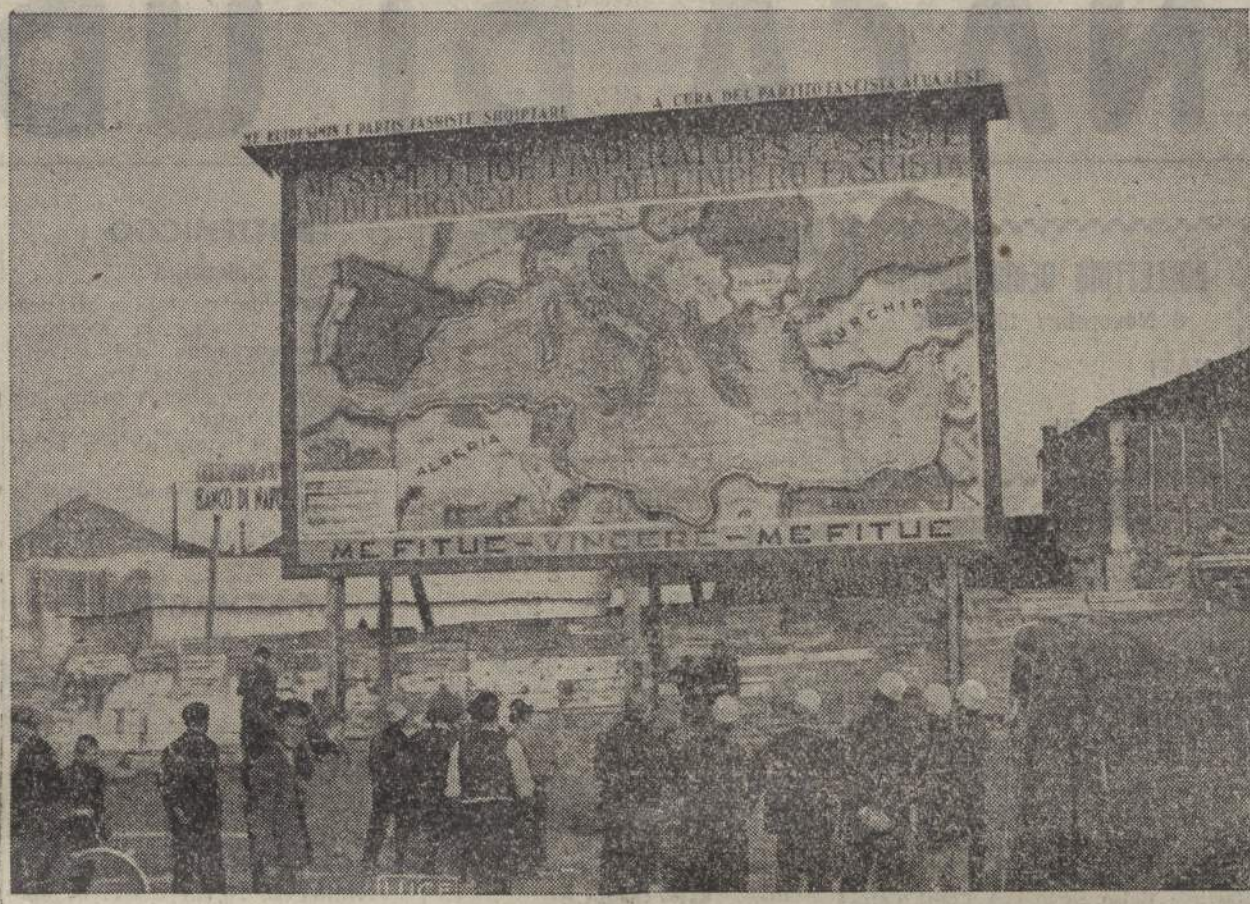
Una grande Carta del Mediterraneo è stata esposta a Tirana, affinché la popolazione possa seguire lo svolgimento della guerra