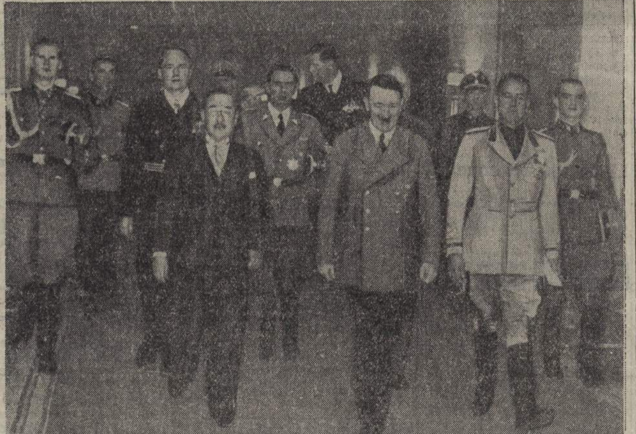
Una foto inedita della firma del Patto Tripartito a Berlino. - Al Palazzo della Cancelleria di Berlino. Da sinistra: il conte Galeazzo Ciano; il Fuehrer; l'ambasciatore giapponese a Berlino Kurusu; Von Ribbentrop; Alfieri; Von Mackensen ambasciatore di Germania a Roma

l'antidolorifico sovrano. Nel chiedere il Veramon insistete sempre per avere l'imballaggio originale: Bustina da 2 compresse L. 1,25. Tubo da 10 compresse L. 6. Tubo da 20 compresse L. 11. Le vere compresse di Veramon portano inciso da un lato il nome Veramon e il peso (gr. 0,4) e dall'altro lato la dicitura E. Schering, come appare dalla figura sopra riprodotta. Soc. Italiana Prodotti Schering Sede e Stabilimenti a Milano