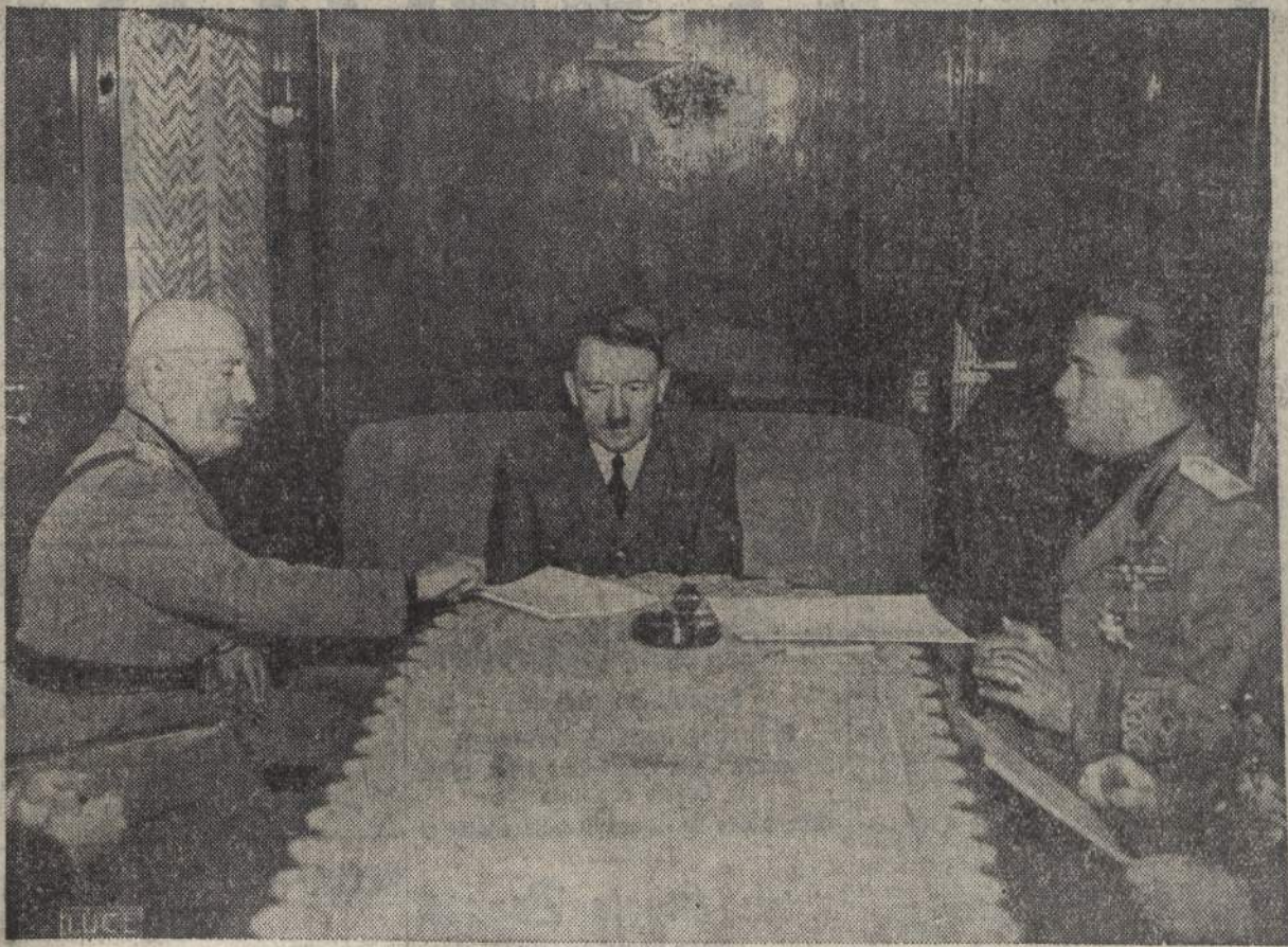
L'incontro del Brennero - I due Capi al tavolo delle conversazioni