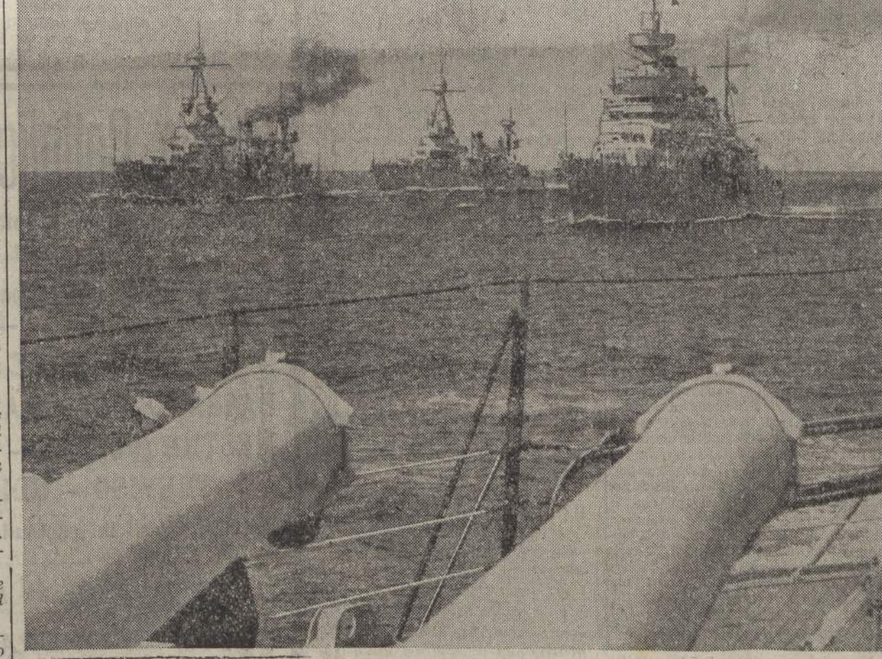
Immagini della guerra sul mare

Il senatore isolazionista Gerald Nye, noto per la sua inchiesta sui fabbricanti di armi, che mise in luce la responsabilità avuta dagli ambienti bancari nell'intervento