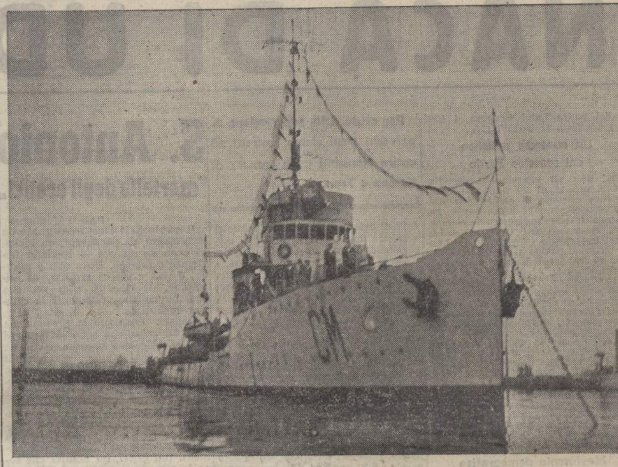
La R. Torpediniera «Calatafimi» dopo l'eroica impresa innalza il gran pavese e rientra al porto

La documentazione potrebbe continuare, ma è già bastevole per dare il necessario e giusto risalto alla parola ammonitrice ed equa di Pio XI, cui, viceversa, venne data aperta e unanime adesione dai Governi e dalla stampa dell'Italia, della Gran Bretagna e degli Stati Uniti.