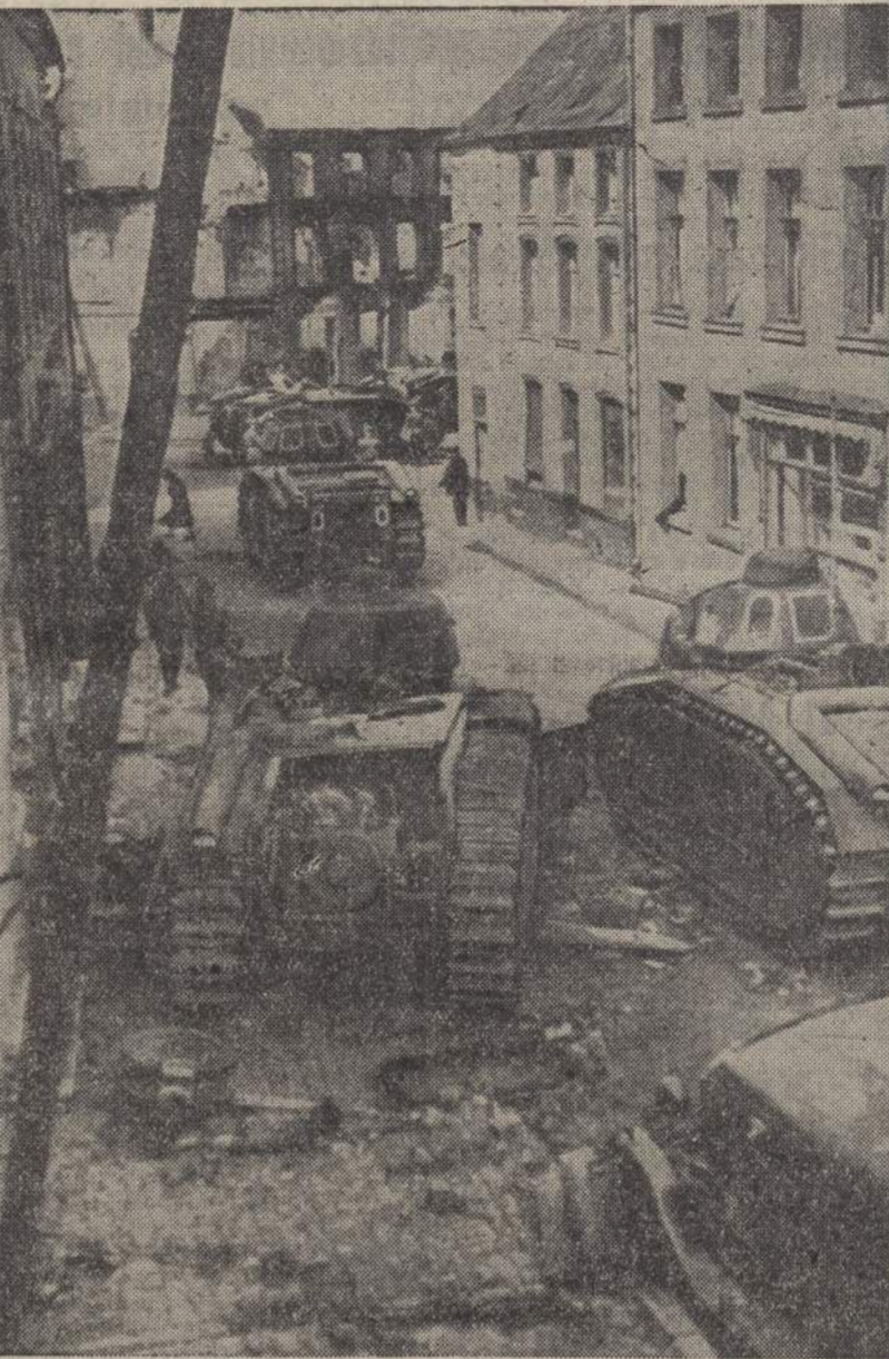
Carri d'assalto francesi colpiti dall'artiglieria tedesca

Il Fuehrer ha quindi affermato che la Germania ha deciso di riavere le proprie colonie e le riavrà; e che la Germania non ha alcuna intenzione di distruggere l'Impero