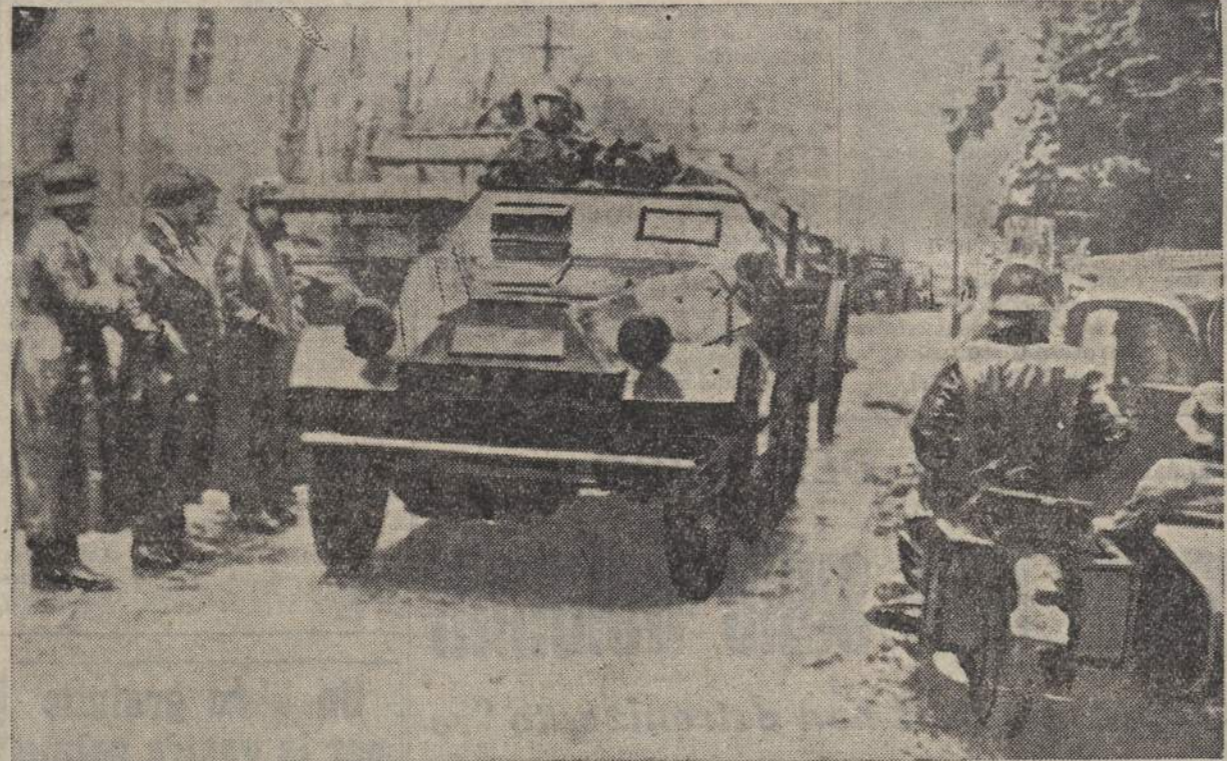
Una colonna motorizzata germanica nei pressi di una città belga

Ora la richiesta è rinnovata e con carattere di urgenza, infatti mentre squadriglie di navi leggere alleate incrociano fra le isole greche, truppe turche si trovano già ammassate e pronte per l'imbarco.