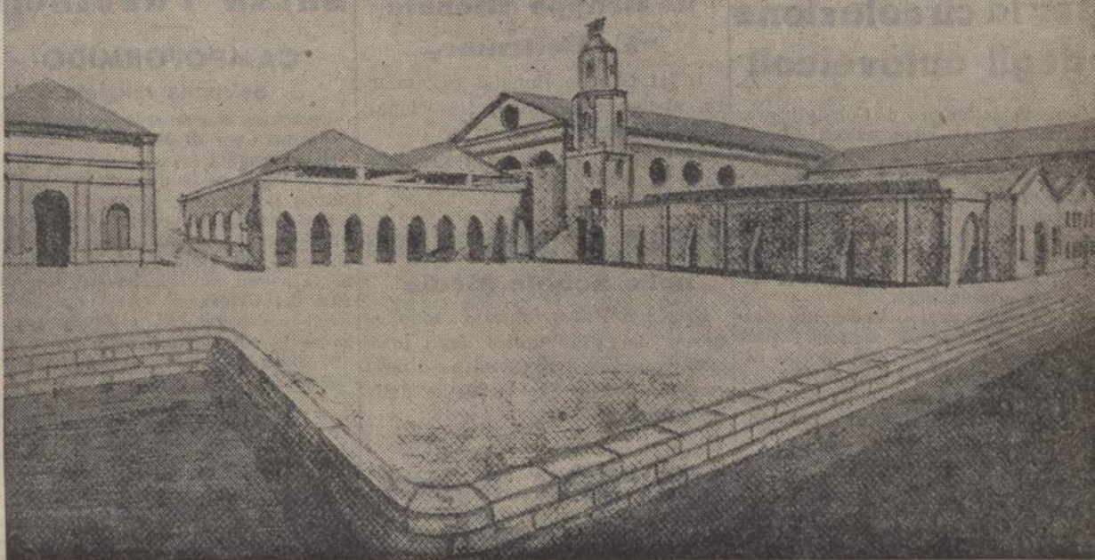
VENEZIA - La nuova sistemazione dell'Arsenale in prossimità della Torre Campanella

La laguna veneta è più che mai silenziosa in questo mese settembre dal silenzio della sua storia millenaria piena di fasti e di splendore.