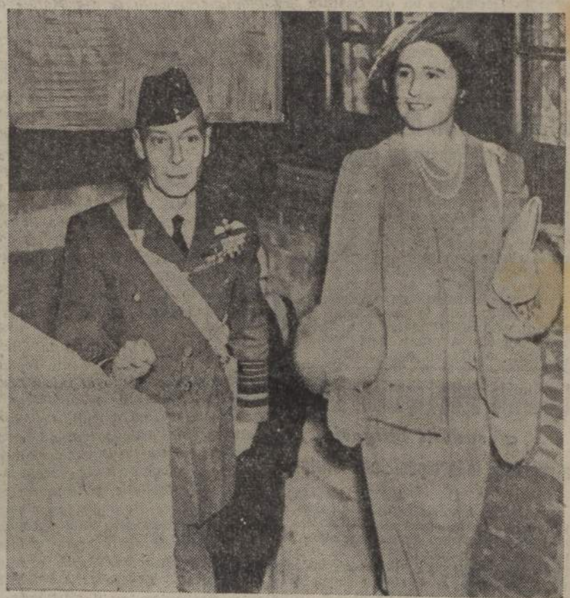
I Sovrani inglesi visitano un ricovero antiaereo in Londra