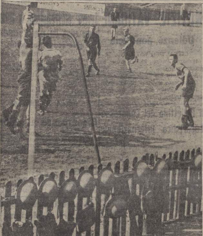
Una partita di calcio a Londra fra i rappresentanti i due reparti dell'Esercito. Si nota nella palizzata la maschera antigas e gli elmi dei giocatori

REDAZIONE: Via Treppo, 3 - Telefono n. 700