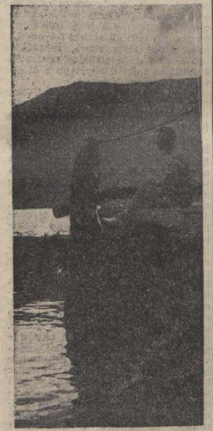
La vela e il timone di un barcone lariano.