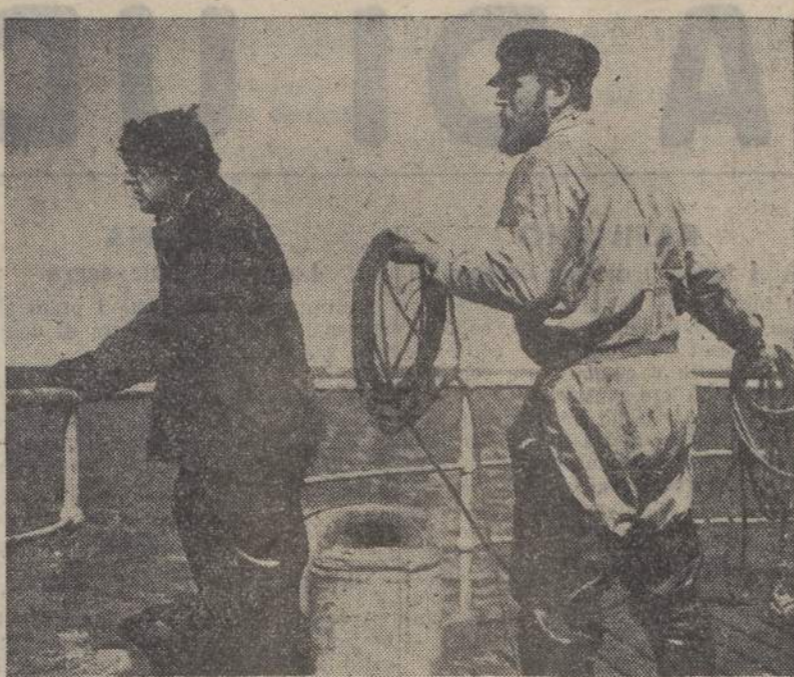
Dal film svedese «Pescatori di balene» (Svensk Filmindustria)

Aereo da caccia inglese precipitato LONDRA, 30 sera. Un aeroplano da caccia dell'aviazione inglese è precipitato nel giardino di una scuola presso Gray's. Il pilota è rimasto ucciso.