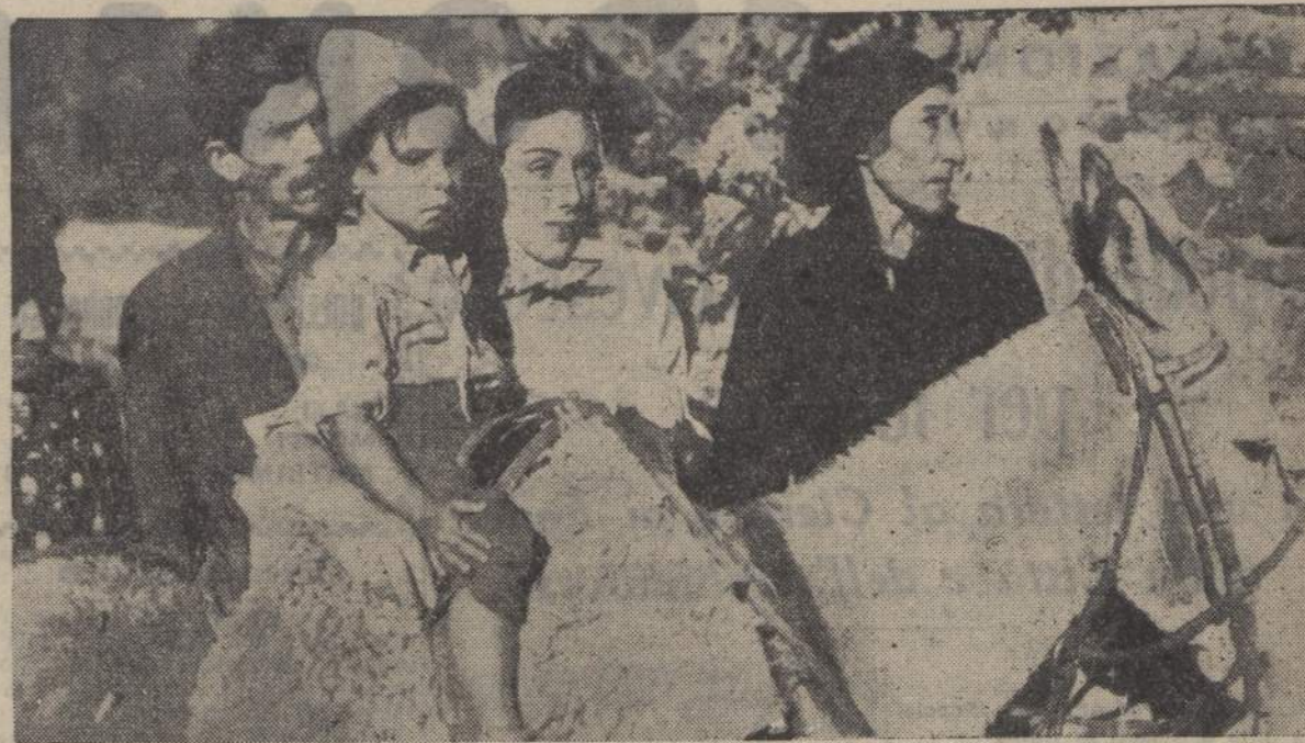
Dal film argentino «De la Sierra al Valle» di Anton Ber Ciani (SIDE)