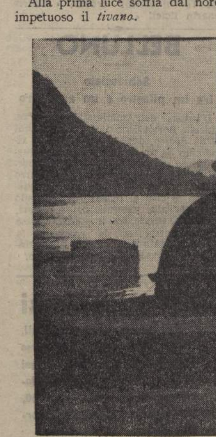
Un barcone lariano sul lago di Como.

Hanno tutti un'unica caratteristica, la vela quadrata, e non la vela latina triangolare, né fiocco, né pappafico. La ragione deve trovarsi nei venti che soffiano sul lago con precisione cronometrica, quando il tempo non è perturbato, e che determinano ferreamente le leggi della navigazione. Alla prima luce soffia dal nord impetuoso il tivano.