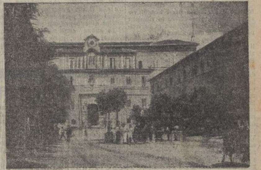
La facciata del Palazzo Pontificio

di sovrana libertà si impone un alto senso del Suo dovere apostolico. Se Pio X veniva di nostalgia per la sua Venezia e Pio XI sognava ancora le Alpi, Pio XII non può certo dimenticare la sua costante mobilità e le Sue rapide corse quotidiane fuori dalle anguste mura del Vaticano. Se Pio XI è stato il Papa alpinista, Pio XII lo si può dire il Papa viatore e il Papa aviatore. Il Papa del suo tempo avrebbe pensato che la sua fastosa casa di campagna sarebbe diventata un giorno la casa di campagna dei Papi. Chi l'ha vista nel febbraio del '30 quando il Papa della Conciliazione la riscattò da un silvestre e fatiscente abbandono, sa quali ingenti opere occorsero perché diventasse degna residenza forense dei Pontefici. L'impronta di Pio XI