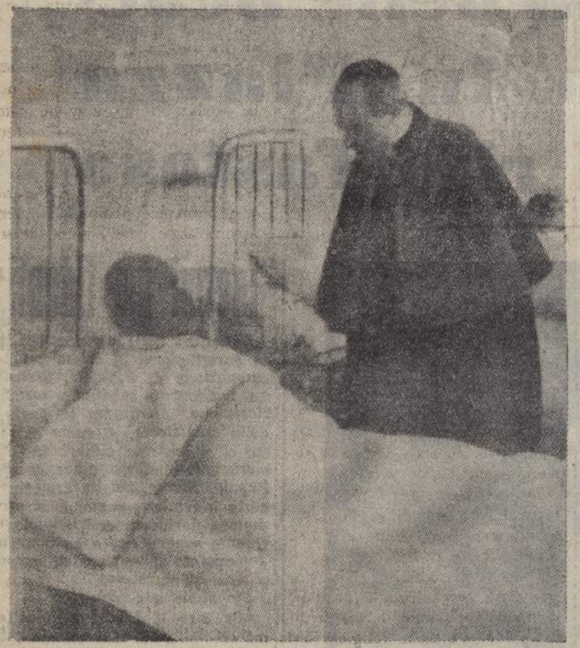
Pio XII - quand'era Cardinale - in visita agli ammalati dell'Ospedale di S. Spirito in Roma.

ROMA, 4 sera. Si apprende che assai commovente è stata la visita dei familiari al Pontefice che ha impartito loro la prima benedizione, come Papa, fra l'emozione intuitiva di tutti i presenti. Erano presenti le sorelle e i cognati, su questa visita il prof. Mengarini, cognato del Pontefice ha dichiarato: «E' stato quello un momento di grande commozione, il Pontefice si è visto con tanto di persone più care del suo cuore, dai nipoti, dai cognati, dalle sorelle, e si è intrattenuto con essi per più di mezz'ora in discorsi affabili e familiari. «Nel suo appartamento privato, il