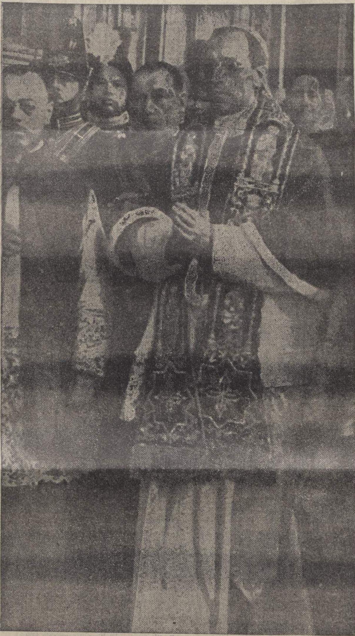
La ieratica figura di Pio XII che indossa per la prima volta gli indumenti papali

«Tu sei Pietro...», canterà la liturgia dell'Incoronazione; mentre il nuovo Pietro ripete da oggi al Fondatore della Chiesa, che lo ha scelto come pietra d'angolo, la professione di fede del Principe degli Apostoli a Cesare di Filippo: «Tu sei il Cristo, il Figlio di Dio vivente».