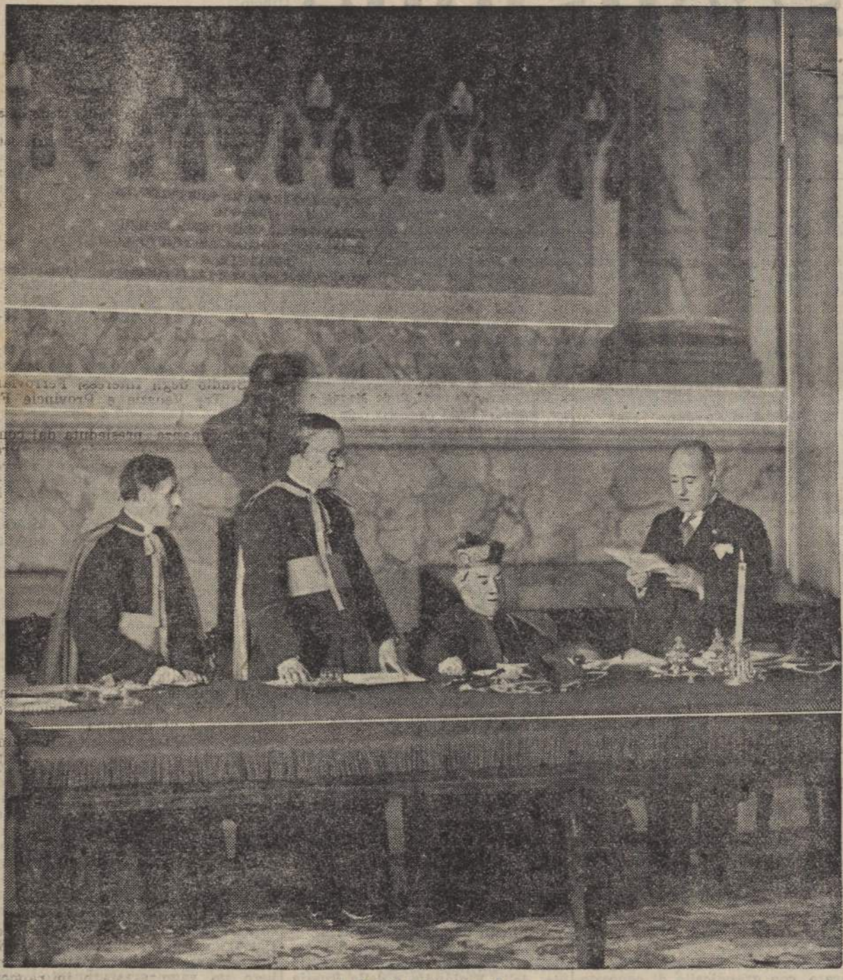
I Patti Lateranensi

Il grande evento della Conciliazione pone in un particolare risalto storico la figura di Pio XI. La conclusione della Questione Romana resta una sua gloria imperitura.