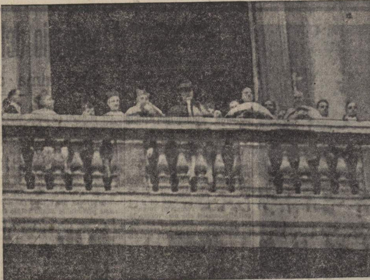
La prima benedizione al popolo dell'Urbe e dell'Orbe

la retta e sicura soluzione dei terreni problemi che possiamo chiamare cosmopoliti, perché sono l'espressione delle preoccupazioni causate dagli errori e travicimenti della epoca moderna.