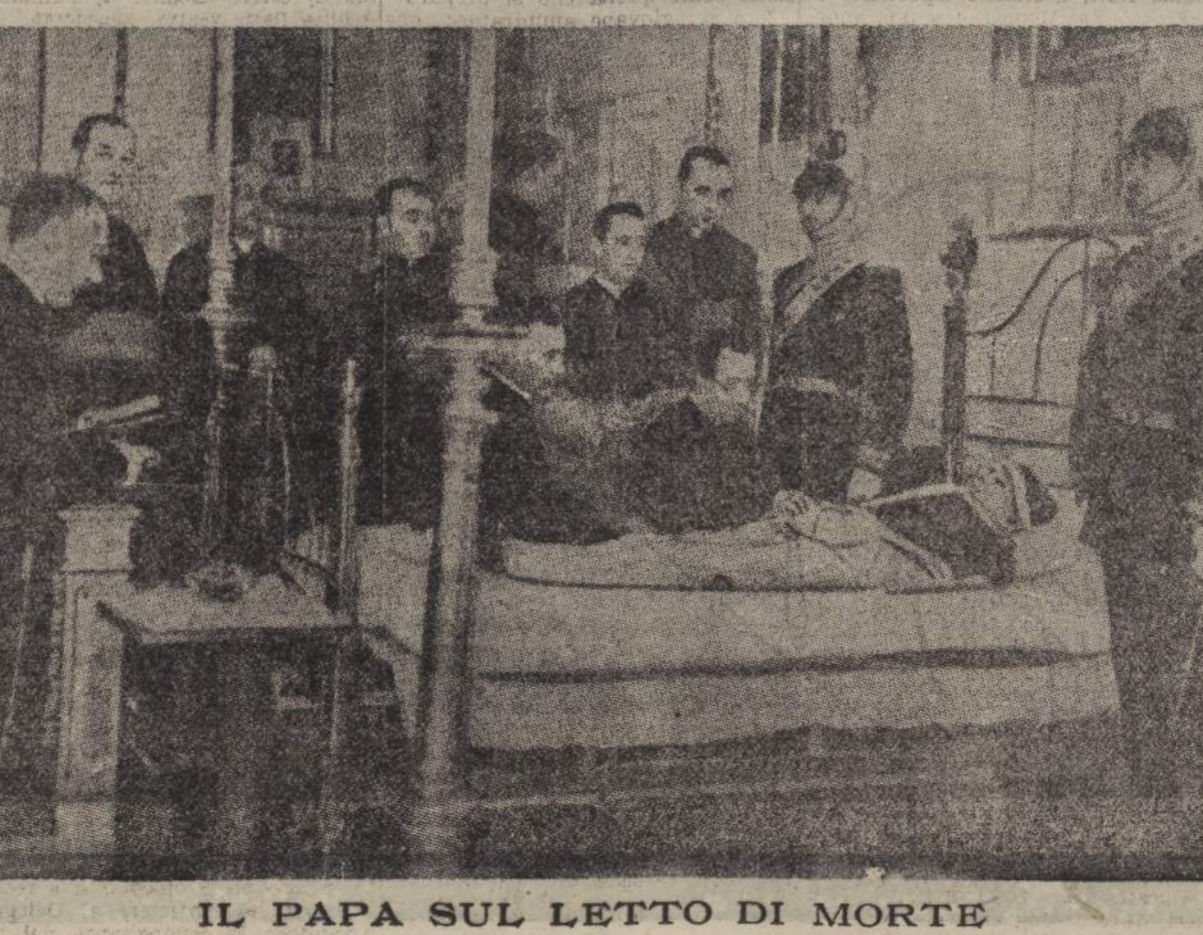
IL PAPA SUL LETTO DI MORTE

L'ANNUNCIO FERALE Città del Vaticano 10, ore 6 Il Santo Padre PIO XI è serenamente spirato alle ore 5,31.