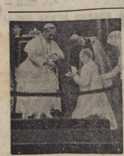
Ricevendo le Giovani di A. C.

La prima e l'ultima parola di Pio XI... Faccia l'addio che l'auspicio non fallisca.