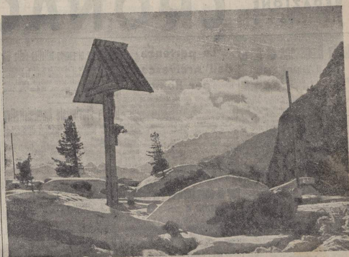
Paesaggio dal Passo di Falzarego (m. 2117) verso la Marmolada

La Diffusione del cristianesimo al principio del sec. IV, che nell'originale francese è monocroma e molto meno perspicua. In conclusione, c'è da rallegrarsi sinceramente dell'esimo acquisto che fa in materia si ardua la bibliografia italiana; ma insieme sarà opportuno formulare il voto, che non sia troppo lontano il giorno in cui, con nobile e fraterna gara, anche in Italia si preparino lavori originali del valore di questo.