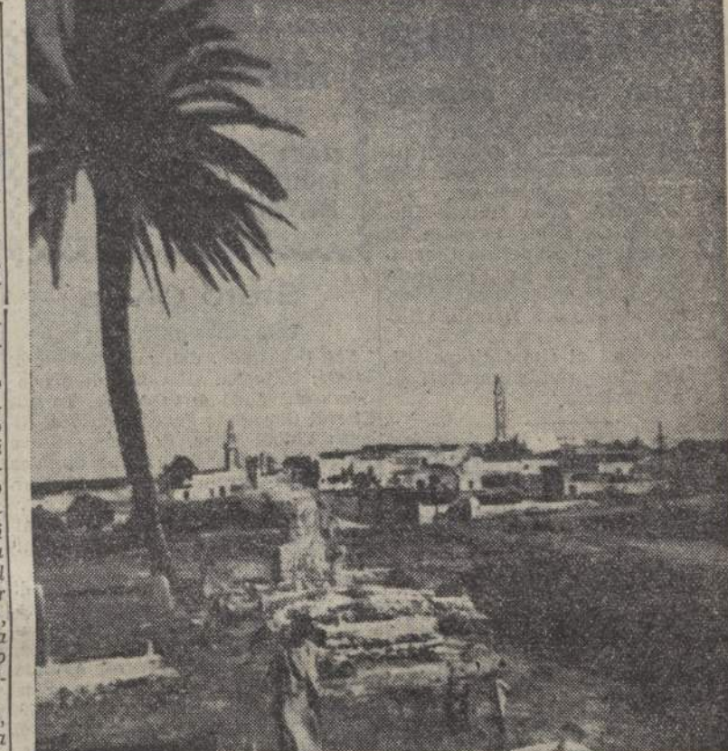
Tipico paesaggio musulmano

Oggi el-Azhar ha marcato un punto sulla Mecca, che pur era risorta per l'assidua opera del re-