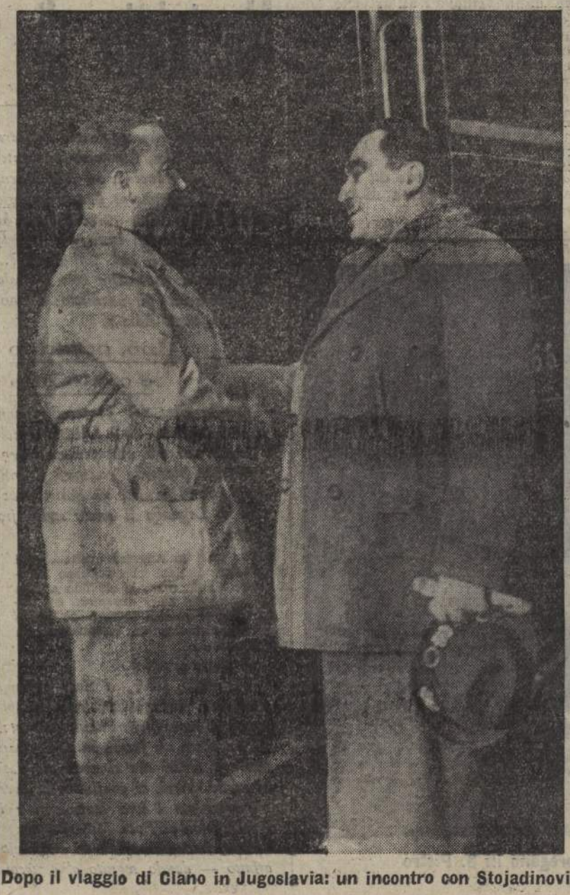
Dopo il viaggio di Ciano in Jugoslavia: un incontro con Stojadinovic