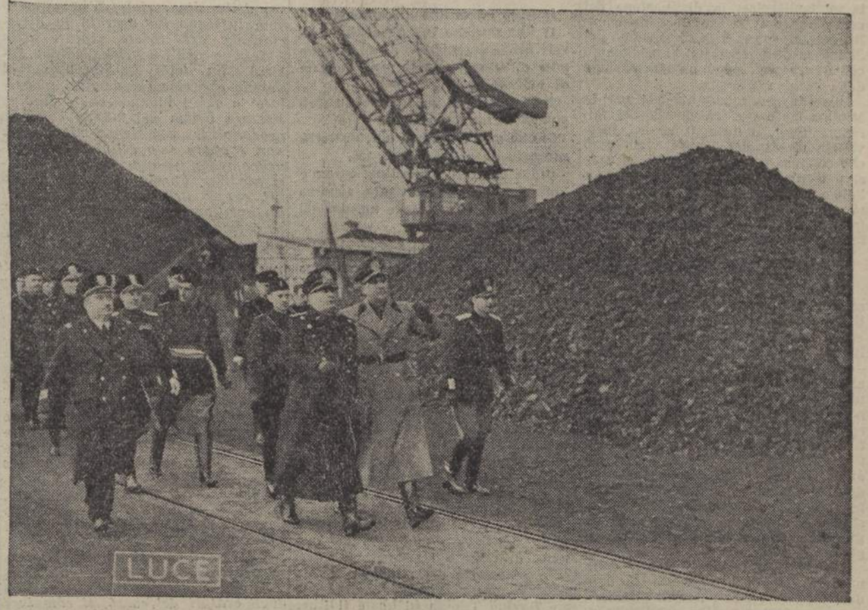
Mussolini visita le miniere