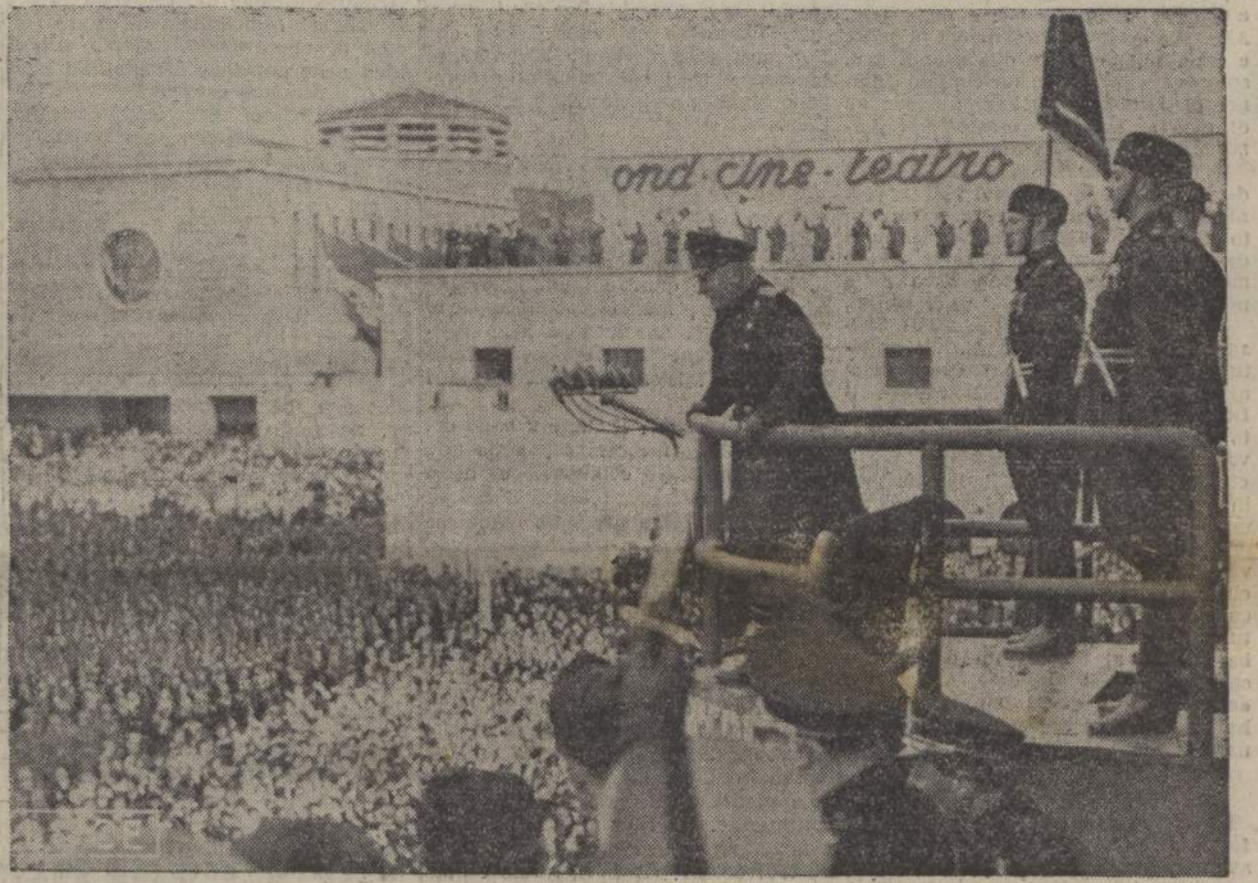
Il Duce parla al popolo