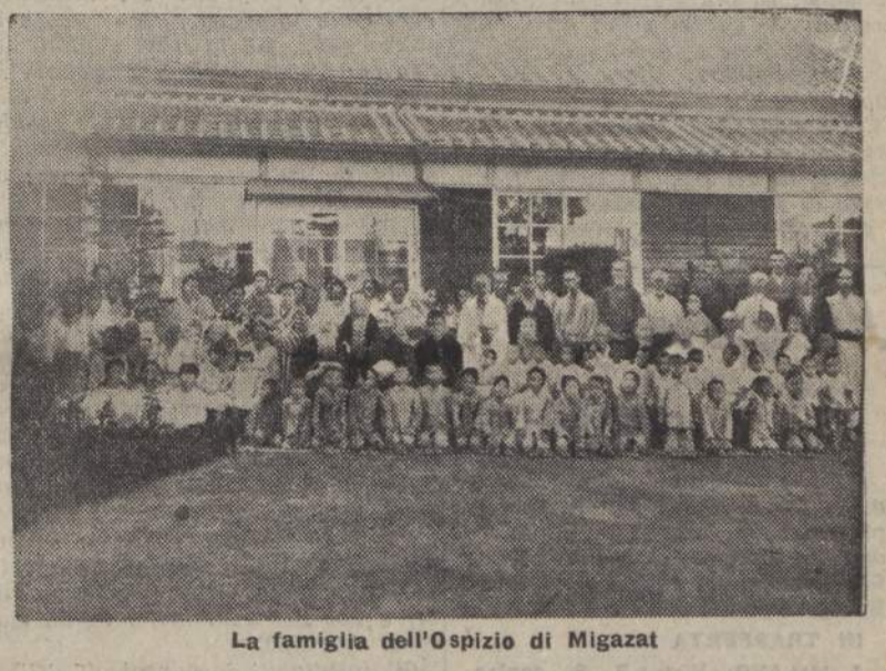
La famiglia dell'Ospizio di Migazat

Questo modo di pensare e di agire si deve anche al prestigio, che l'Italia gode nel mondo. Certamente al prestigio e al fascino d'Italia, originato dalla sua storia, incentrata in Roma. E, con Roma, la cattolicità. E, con Roma, la lotta contro i principi che minacciano la civiltà mondiale. Vi ha cooperato un fatto nuovo che l'ambasciata non venne per un fine particolare utilitaristico (come sarebbe una commissione scientifica o commerciale), ma per affermazione di principi, che interessano non solo le nazioni alleate, sibbene tutto il mondo. Il buon popolo Giapponese capi e si mosse con un cuore solo intorno ai rappresentanti d'Italia.