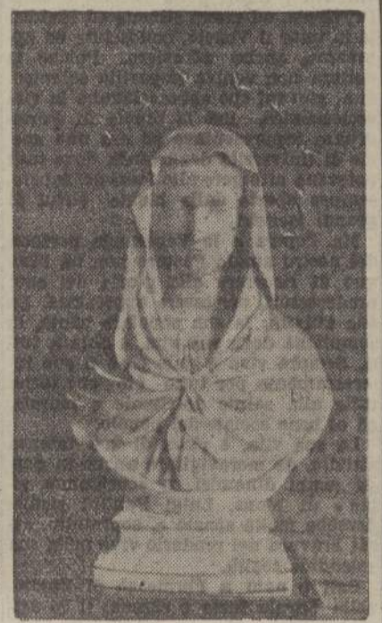
Il busto donato da Pio IX opera di Salvatore Benelli

ATENE, 3 sera A causa delle piogge torrenziali, si sono verificati franamenti di terreno nel canale di Corinto che ha dovuto essere, provvisoriamente, chiuso alla navigazione.