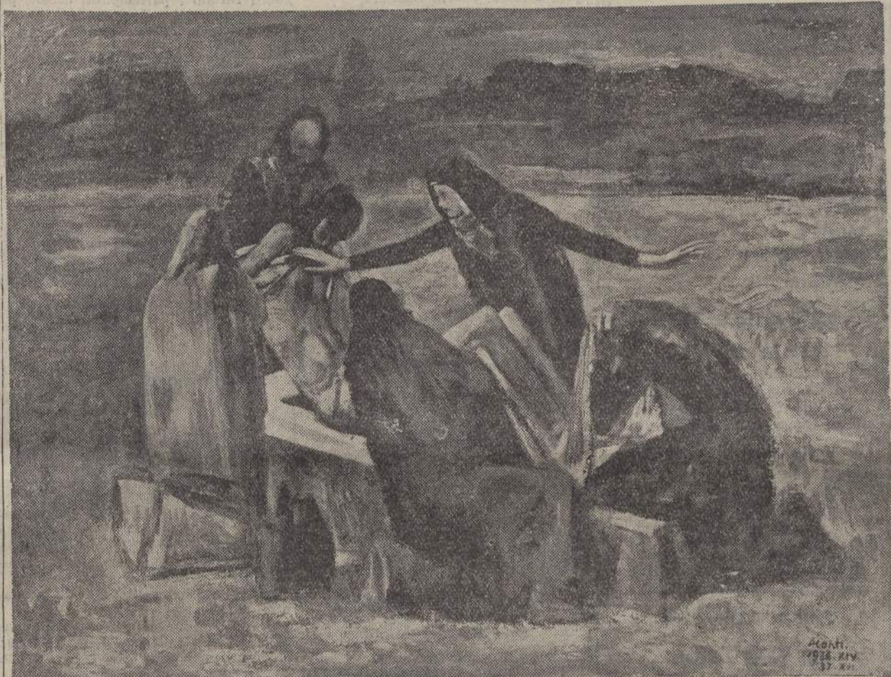
Il direttore generale della Stampa italiana, Gherardo Casini, ha inaugurato a Firenze, con un limpido discorso la mostra del pittore Primo Conti, indicando nell'opera dell'artista fiorentino quei valori fondamentali, pastici e spirituali che sono nella migliore tradizione della razza e della cultura italiana. Ecco una delle pitture esposte che si ispira alla deposizione di Gesù nel Sepolcro, saggio ragguardevole di arte sacra.