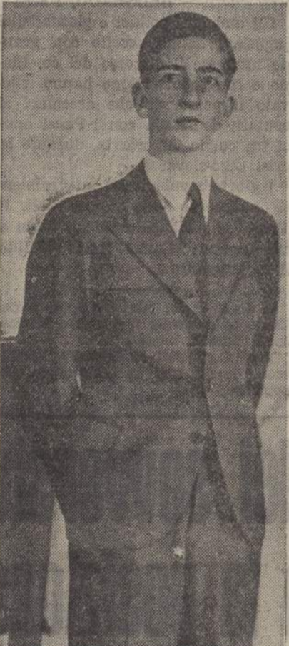
RE PIETRO II DI JUGOSLAVIA

BELGRADO, 1 sera Oggi in tutta la Jugoslavia si è festeggiato il ventesimo anniversario della fondazione del Regno Serbo-Croato-Sloveno. La stampa pubblica lunghi ar-