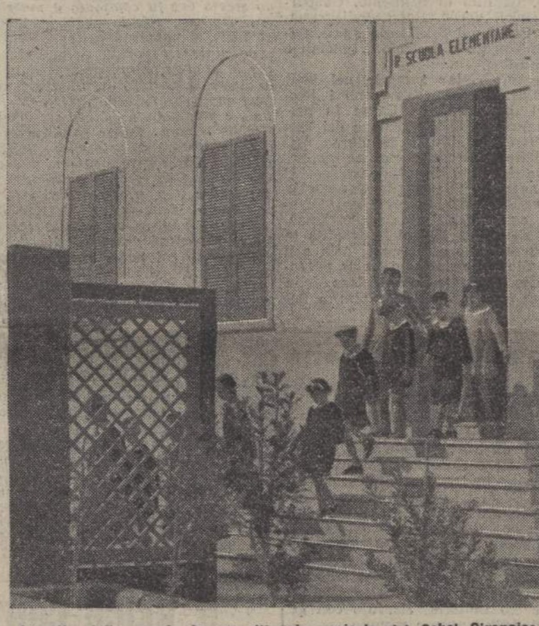
L'uscita dalla scuola in un villaggio agricolo del Cebel Girenaico