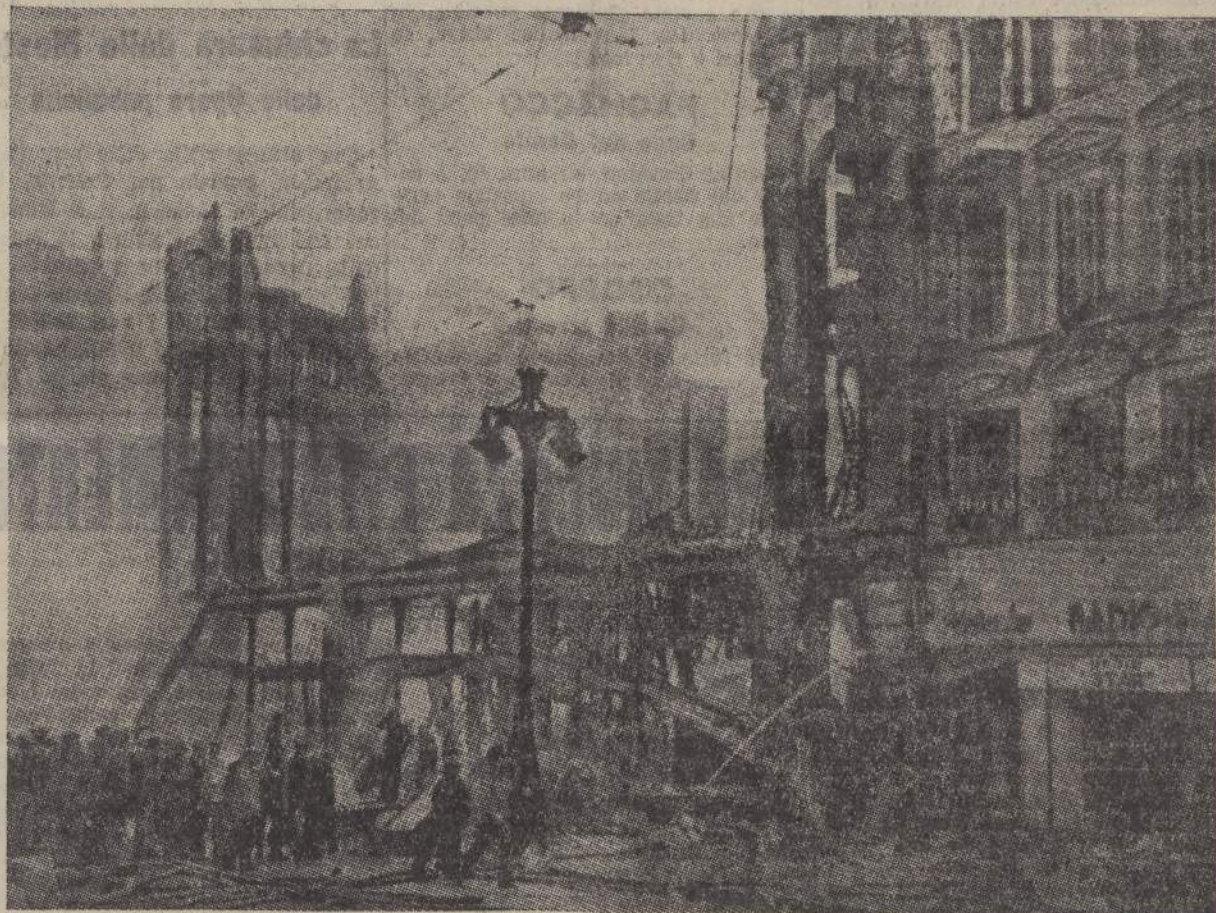
Mozzioni di mura, orbite vuote di finestre, panorama spettrale: ecco la orrida visione dell'incendio di Marsiglia