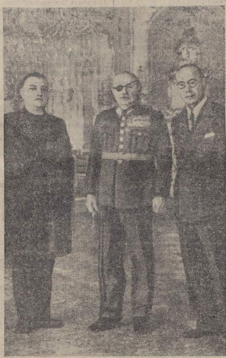
Il genero Sirovy capo del nuovo Governo ceco fra ministro Tiso, capo dello Stato confederato slovacco e il Ministro degli Esteri, Ghwalkosky

ALBA, 17 sera. Il Ministro dell'Agricoltura e Foreste ha inaugurato ieri la decima fiera del tartufo.