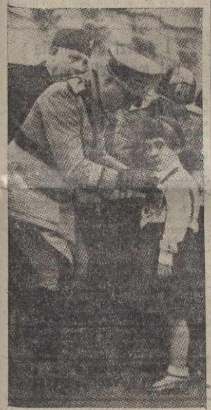
Il generale Russo consegna la medaglia al v. m. alla figlia di un Caduto