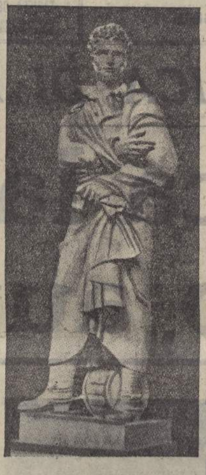
La statua, opera dello scultore A. Bertì, scoperta in S. Croce (S. P. F.)