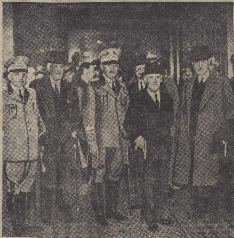
La Missione militare britannica a Roma