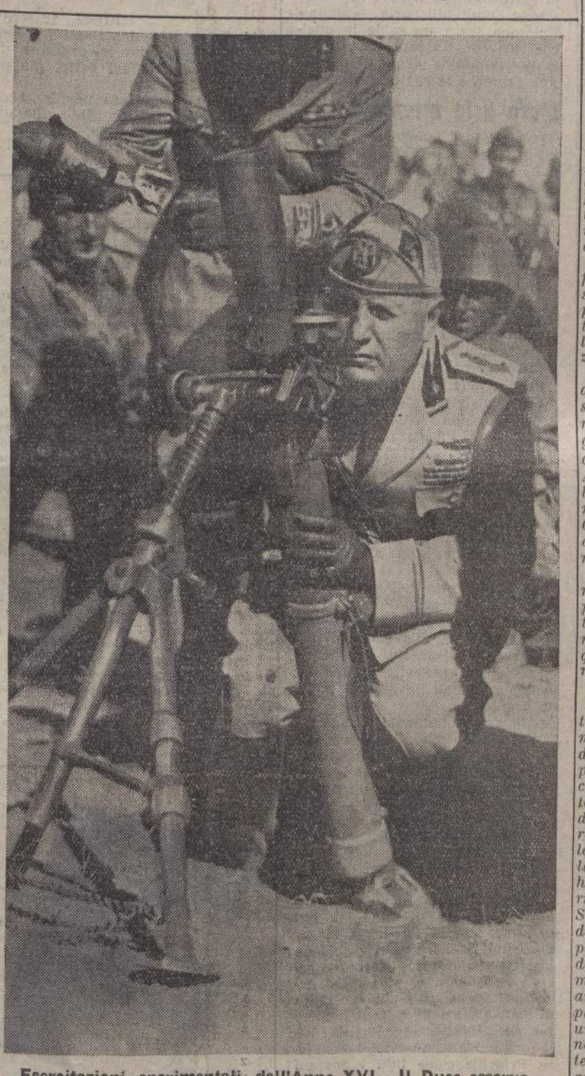
Esercitazioni sperimentali dell'Anno XVI - Il Duce osserva i nuovi tipi di armi

PARIGI, 12 sera. Le parole del Duce alla fine delle manovre sperimentali del Corpo d'Armata di Roma sono considerate in certi settori francesi particolarmente interessanti, quale indizio che tali manovre hanno confermato le teorie e i calcoli che hanno indotto lo Stato Maggiore Italiano all'adozione delle nuove formule. La stampa francese nota che le parole del Duce « prendono particolare situazione internazionale » e sottolinea quindi con vigore l'affermazione mussoliniana « non prepararsi è un delitto », quasi a valere implicitamente di monito per coloro che, in Francia, siano ancora tentati di cullarsi nelle illusioni. « Seria avvertenza », scrive Paris Midi.