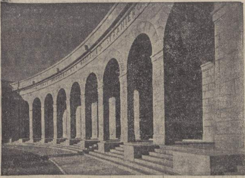
Ossario di Fagarè della Battaglia

(Rievocazioni di un "Corrispondente di guerra.")