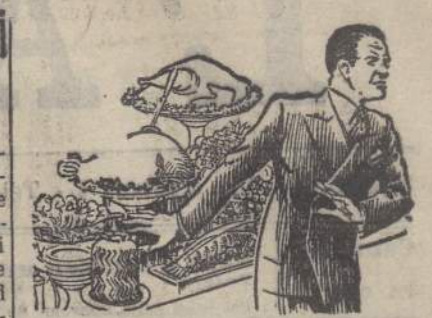
La vista del cibo mi disgusta

FICCE', 14 sera. Il Sottosegretario all'Africa Italiana ha ripreso il suo viaggio verso il Nilo Azzurro per ispezionare i lavori stradali in corso, festosamente accolto, in tutti i villaggi ed in tutti i cantieri, dalle masse lavoratrici nazionali ed indigene ed alle popolazioni schierate ai margini della strada. Dopo aver passato in rivista le truppe del Presidio di Quozim, S. E. Teruzzi ha compiuto l'ultimo tratto del percorso che, attraverso 25 chilometri di una pittoresca strada, scende da 2700 a 200 metri di altezza sulle rive del Nilo Azzurro. Transitando sul ponte di barche lungo circa 100 metri, costituito dal genio militare, si è poi portato alla riva opposta, recandosi a visitare gli impianti della teleferica, che assicura il trasporto ausiliare delle merci tra le due sponde del fiume. Traghettato al ritorno, il Nilo in senso inverso, è stato intrattenuto con gli operai ed i soldati del Genio, e rientrato a Ficce'.