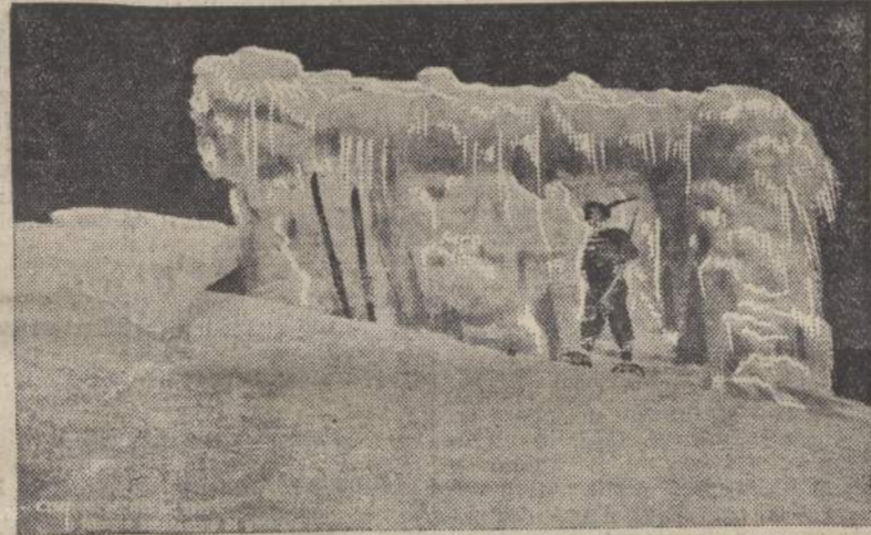
Il monumento coperto di ghiaccio

Gli austriaci con violenti contrattacchi tentarono riprendere le posizioni, ma furono sempre ricacciati dentro le trincee con gravi perdite; in un tentativo contro il Vralo perdettero un intero Battaglione di Honved. Visti vani tanti sforzi, i comandanti austriaci sospesero le azioni, nonostante le pressioni del gen. Boroevic. Allora il gen. Etna decise l'attacco finale al dente.