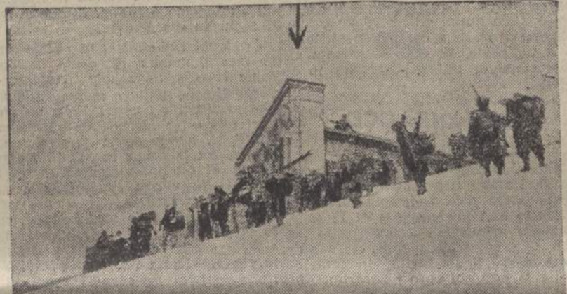
Rifugio e monumento agli Alpini sul Monte Nero

Il gruppo del ten. col. Tardif doveva attaccare sul rovescio, sviluppando l'azione sul Vralo col Battaglione Sues; il Gruppo del ten. col. Tedeschi doveva attaccare di fronte col Battaglione Exilles. L'esito dell'operazione aveva fondamento e probabilità unicamente sull'iniziativa e sull'eroismo dei singoli combattenti.