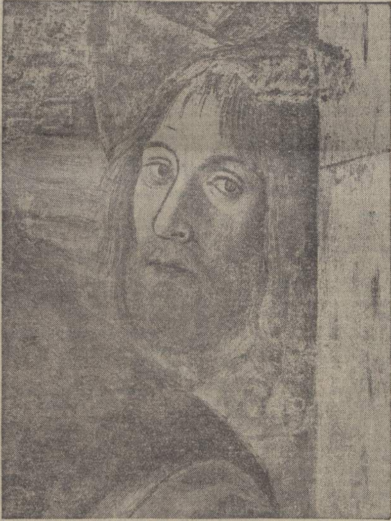
Melorrio da Forlì - L'autoritratto che figura in uno degli affreschi di Loreto.