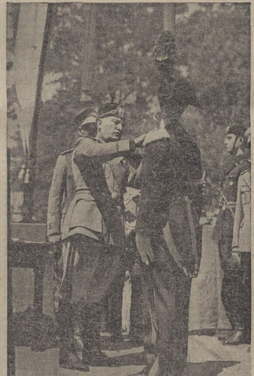
e dal Capo del Governo a Roma