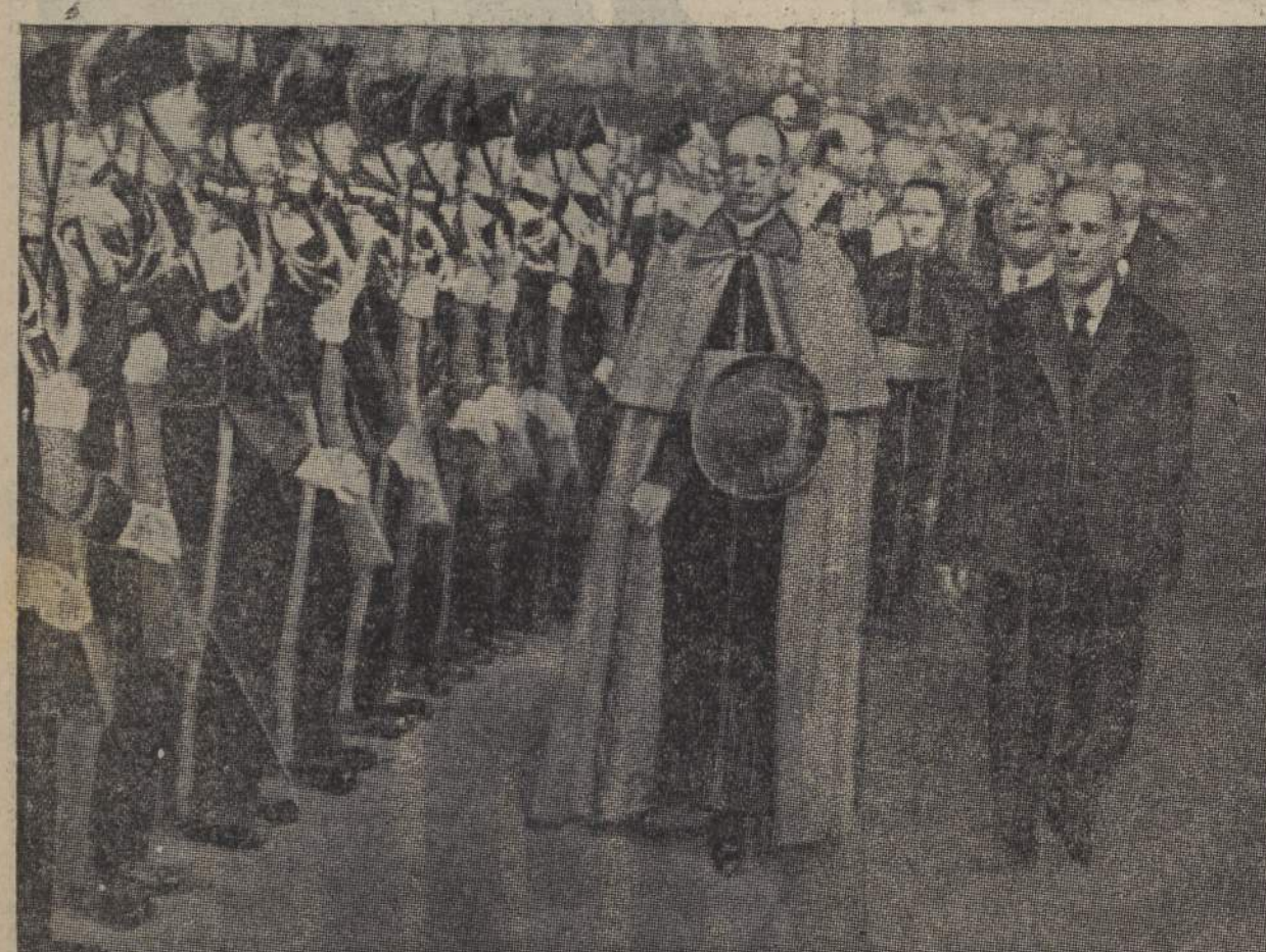
La partenza del Card. Pacelli da Roma

TUTTE LE OPERAZIONI DI BANCA ALLE MIGLIORI CONDIZIONI