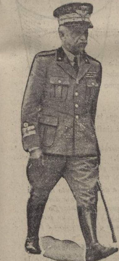
Vedere in seconda pagina: Le giornate del Sovrano in Libia

«Sotto gli auspici della Religione — come dice un No-