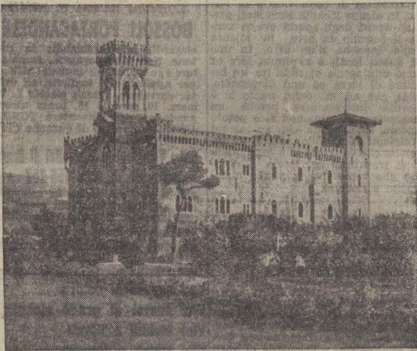
MONTENERO (Livorno) - Monastero delle Suore Vallombrosane

LIVORNO, aprile. Il paesaggio di Montenero - fianchi selvosi e fenditure gialle, villette candide e campanile quadrato - chiude l'orizzonte al visitatore, in una evocazione spontanea dell'età felice, cui ardivano le dolci fole e le figure della capannuccia illuminata.