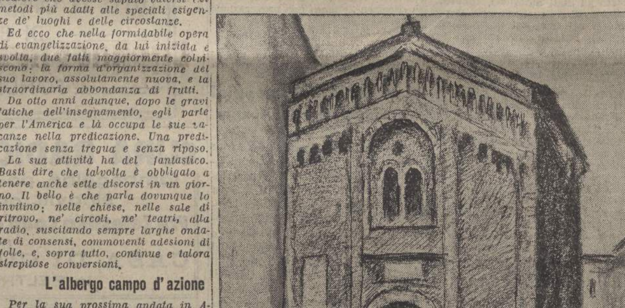
La Parrocchia di Melazzo a Forlì