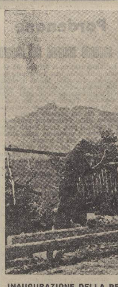
INAUGURAZIONE DELLA PRIMAVERA - Anche nelle valli più elevate è giunto il soffio animatore. Si preparano gli arnesi per la lunga stagione laboriosa e proficua.