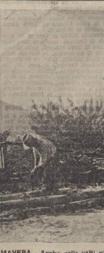
INAUGURAZIONE DELLA PRIMAVERA - Anche nelle valli più elevate è giunto il soffio animatore. Si preparano gli arnesi per la lunga stagione laboriosa e proficua.