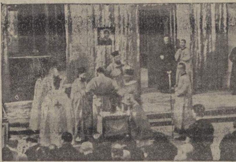
Mentre il Vescovo Greco-bizantino si para