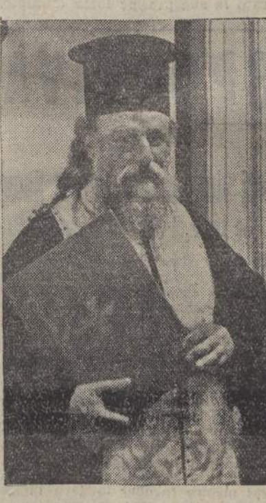
Un Sacerdote di Rito orientale