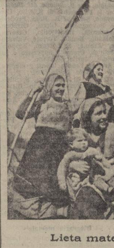
Lieta maternità agreste

Rispondono allo scopo le rose d'ogni colore semplici e a mazzetti, la bouganvillea a frangitura rosso-viola, il solanum Wendlandian, a graziosissimi mazzi a fiori lilla, le glielini, i gelsomini, i canalicoli, piselli odorosi, zucche ornamentali, queste ultime adattate a coprire piccoli chioschi, anfrucci adatti alla sista o alla lettura.