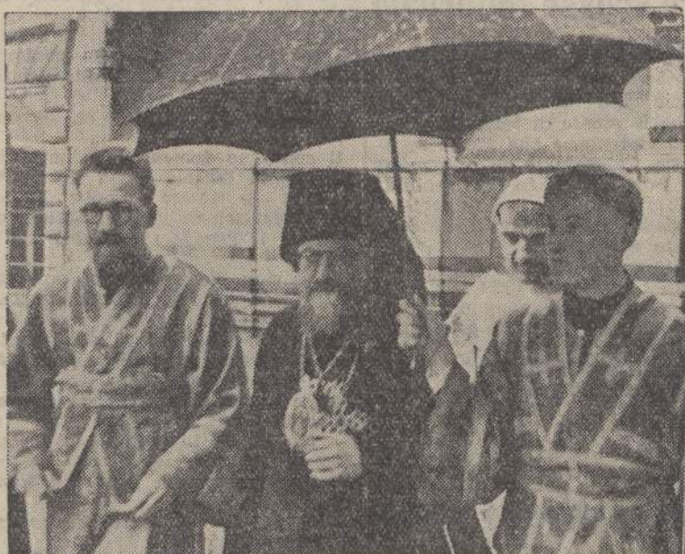
S. E. Mons. Evreinoff si reca al solenne Pontificale