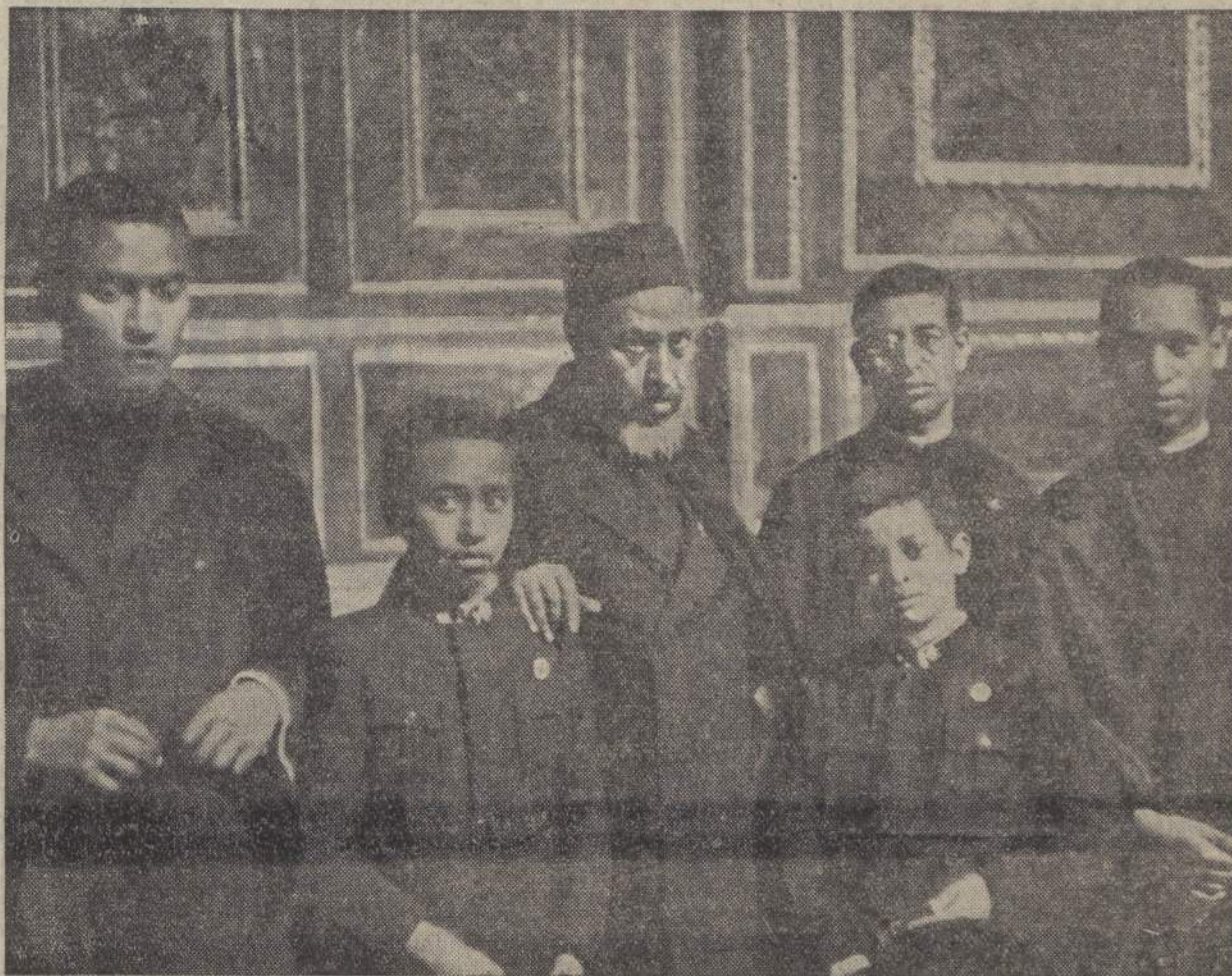
Gruppo di Etiopi del Collegio Etiopico di Roma col Direttore Spirituale