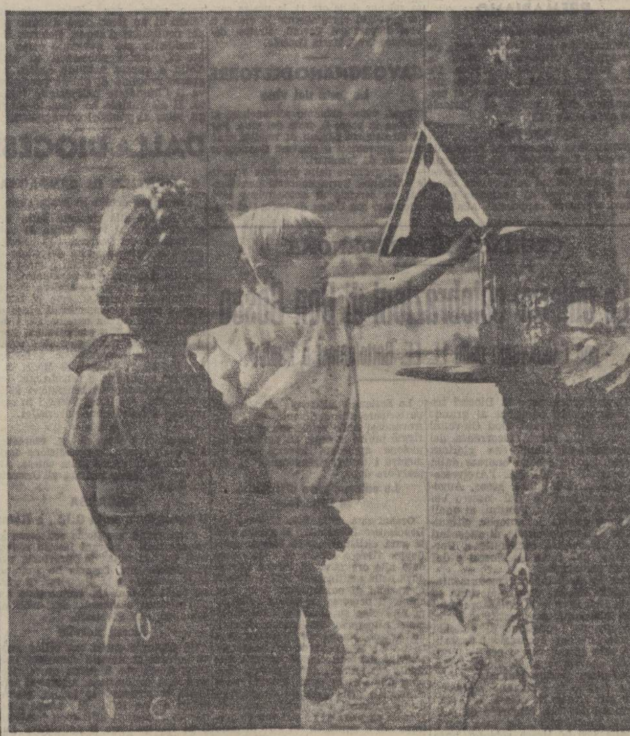
Pietà e poesia