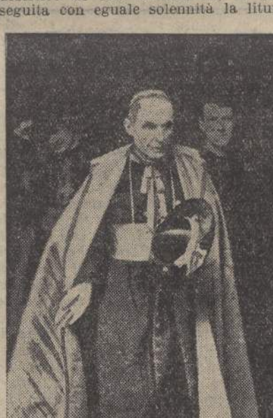
Il Card. Elia Dalla Costa entra nella Badia