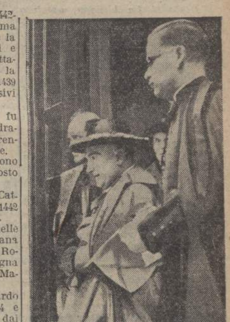
Il Card. Lavitrano esce dalla chiesa della Badia

il Card. Lavitrano esce dalla chiesa della Badia