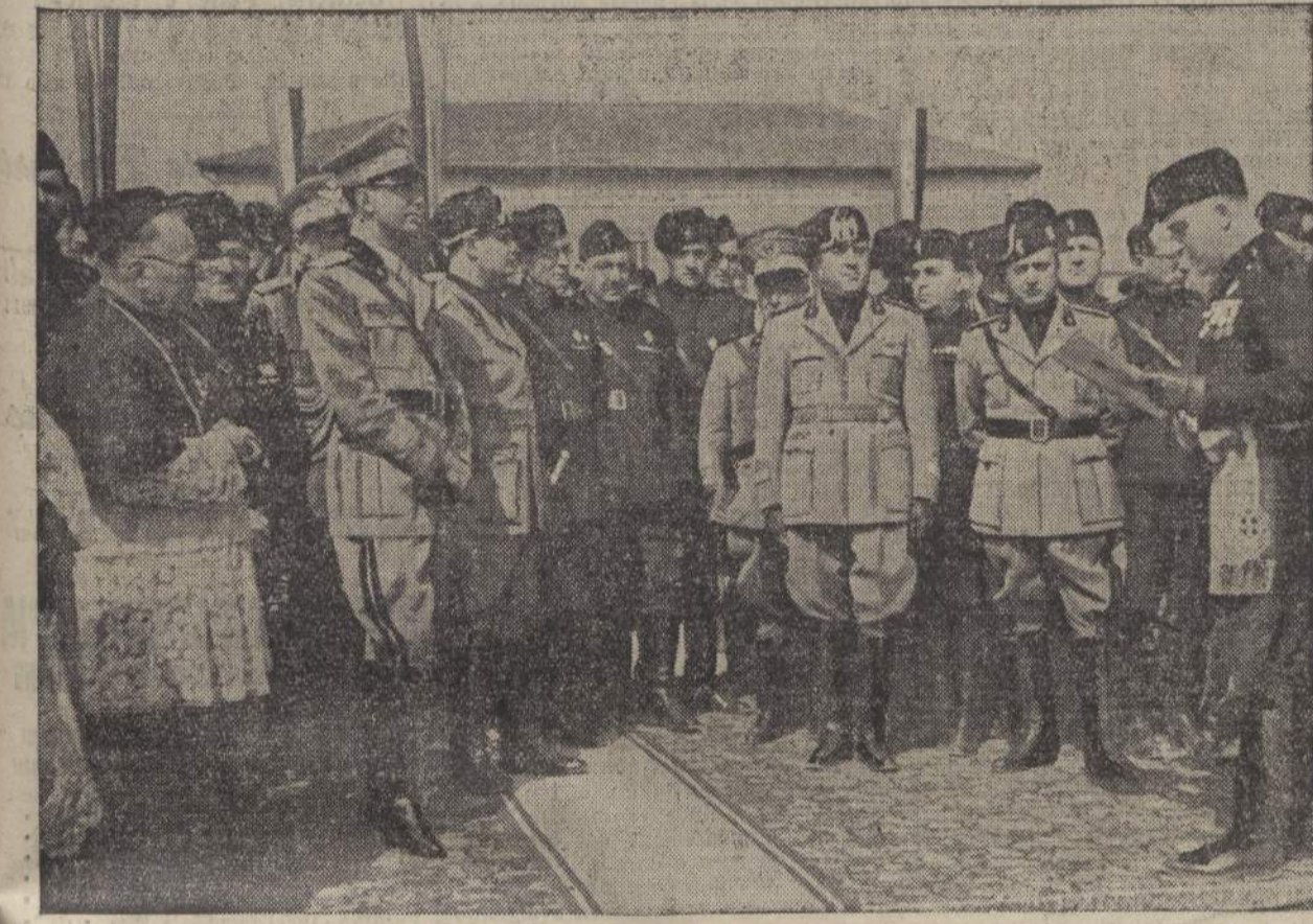
Il discorso del Podestà di Molinella

E non solo nei confini di questa terra che si stende dalle Alpi al mare, ma anche nei più lontani paesi e in tutto il mondo fa sentire e porta le vividi luci di questa grande civiltà cristiana ed italiana, emulando e vincendo, nella storia della Roma nuova cristiana e italiana, antiche glorie di Roma, che erano preludio e presagio delle nuove, immensamente grandi e perenni nel secoli che verranno.