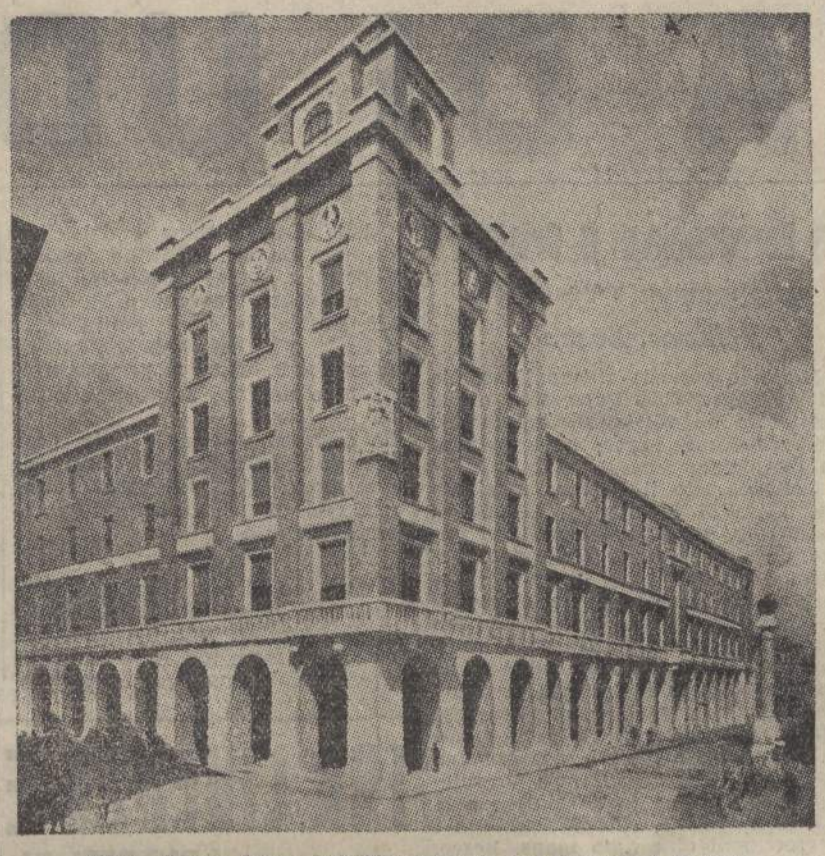
FORLÌ - Il nuovo Palazzo degli Uffici statali che sarà inaugurato il 21 Aprile

Lo sciopero dei cinematografici in tutta l'Inghilterra LONDRA, 19 sera. Lo sciopero degli addetti ai cinematografi si è esteso a tutta l'Inghilterra. Ieri, nei principali centri della provincia, i cinema sono rimasti chiusi. Soltanto a Londra gli scioperanti sono stati sostituiti tempestivamente da personale avvertito. Si calcola che in tutta l'Inghilterra tra operatori, addetti alla proiezione, ed elettricisti il numero degli scioperanti ammonta a 5000 individui. Edifici di un'isola greca crollati in seguito alle piogge ATENE, 19 sera. Nell'isola di Scopelos, in seguito alle piogge, è avvenuta una frana che ha raso al suolo 4 case e ne ha fatte crollare altre dieci. Neve e freddo nei Paesi baltici RIGA, 19 sera. Malgrado la stagione avanzata, viene segnalata una nuova ondata di freddo e la neve cade abbondante nei Paesi Baltici.