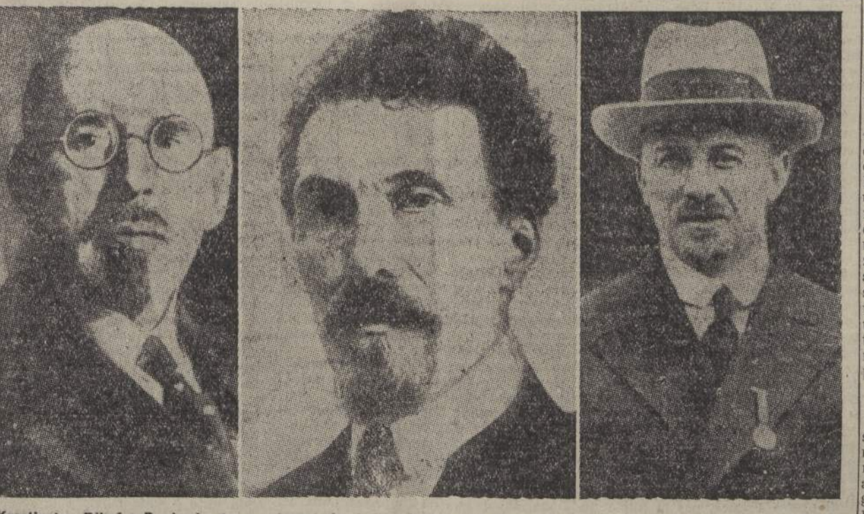
Krestinsky, Rikof e Boukarin, tre «veterani del bolscevismo» che stanno sperimentando la «giustizia» di Stalin

Il rapporto proseguirà quindi con riunioni singole dei Segretari Federali del Consiglio della Milizia, dei lavoratori e dei dirigenti gli Uffici del lavoro.