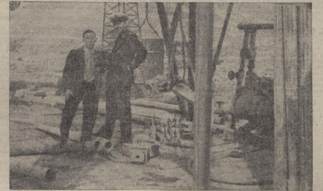
Pozzo petrolifero in costruzione - Il Cappellano di bordo con un minatore

re la casa... dei buoni kutehois... delle buone frittelle dei buoni salcrout... di aver cura delle mie bestie... di sognare la riva al ruscello guardando passare le nubi nel nostro cielo... di invecchiare tra i nostri monti, all'ombra di un campanile che non avrà mai lasciato, e di morire qui, sempre ignorata, dopo essere stata nulla... — Un sogno di piccolo uccello... — Proprio così... un passero, libero sul suo piccolo ramo... Una gabbia in città...? Mail... anche se dorata! Meglio a casa mia, senz'altro. — E poi, un giorno, un altro signor Dubouleau verrà. Prenderà la signorina «Di più» come gerente o direttrice... Chissà!... Ne farà magari la sua bella signora, e la condurrà per sempre in un superbo appartamento a Parigi... — Mail... Mail... — E la giovane alzò la mano con un gesto solenne. — Povera Odile!... Ci sono tante cose per le quali si dice «mai», e che pure capitano... risponde malinconicamente Herrade accomodandosi la pettinatura davanti al vecchio specchio degli antenati... VIII. Un quarto d'ora dopo, Herrade, pensosa e con l'animo angustiato, prendeva a piedi, la via che va da VIII a Steige. Quasi per paura di arrivare, cammina lentamente sul lungo nastro che si snoda e si piega tra le vigne da un lato e i prati verdi dall'altro. Tutto quel paesaggio le è tanto famigliare!