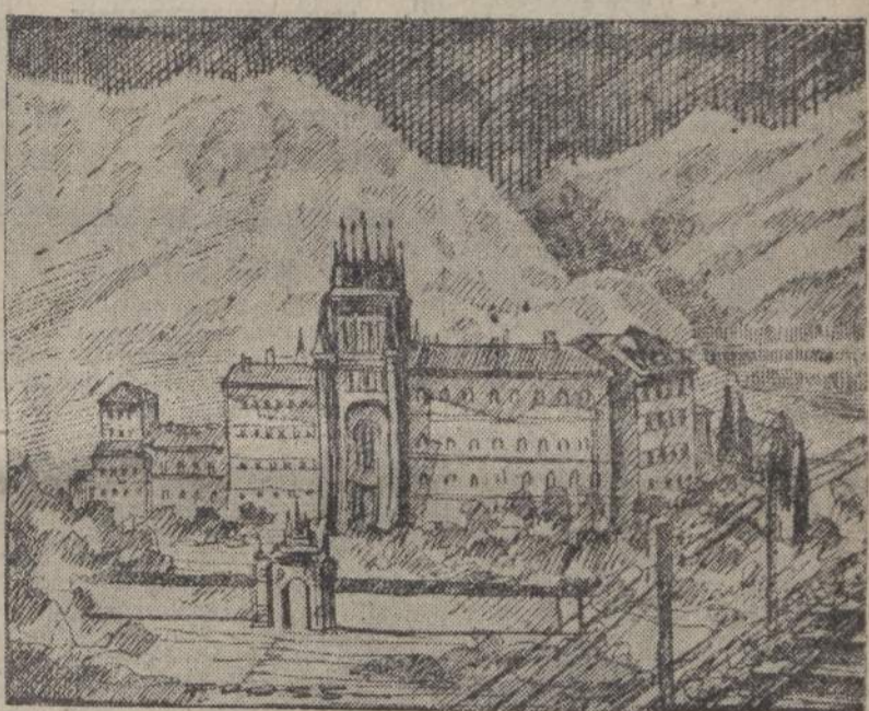
TERUEL - La chiesa di San Pedro

Sul più alto pinnacolo della moresca turrita Teruel è tornata a sventolare la rosso-gialla bandiera di Spagna. L'assedio è terminato e la piccola città d'Aragona riprende il suo compito di sentinella avanzata della riscossa franchista. Se i nazionali sapranno procedere oltre le ultime propaggini dei monti Universali la strada di Valencia è loro aperta e con Valencia è la fine della guerra la cui data, come ha detto il generalissimo e cavalliere Francisco Franco, è più prossima di quanto si creda.