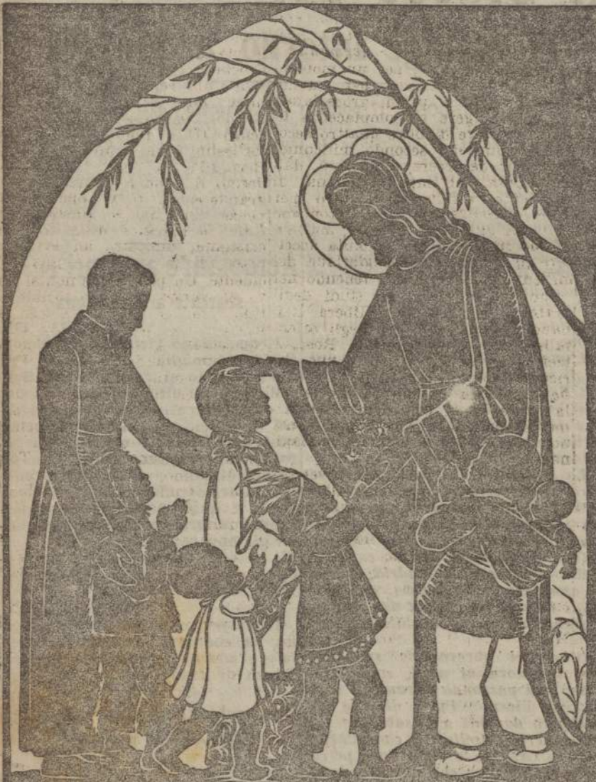
18 OTTOBRE 1936 - Giornata Missionaria Mondiale