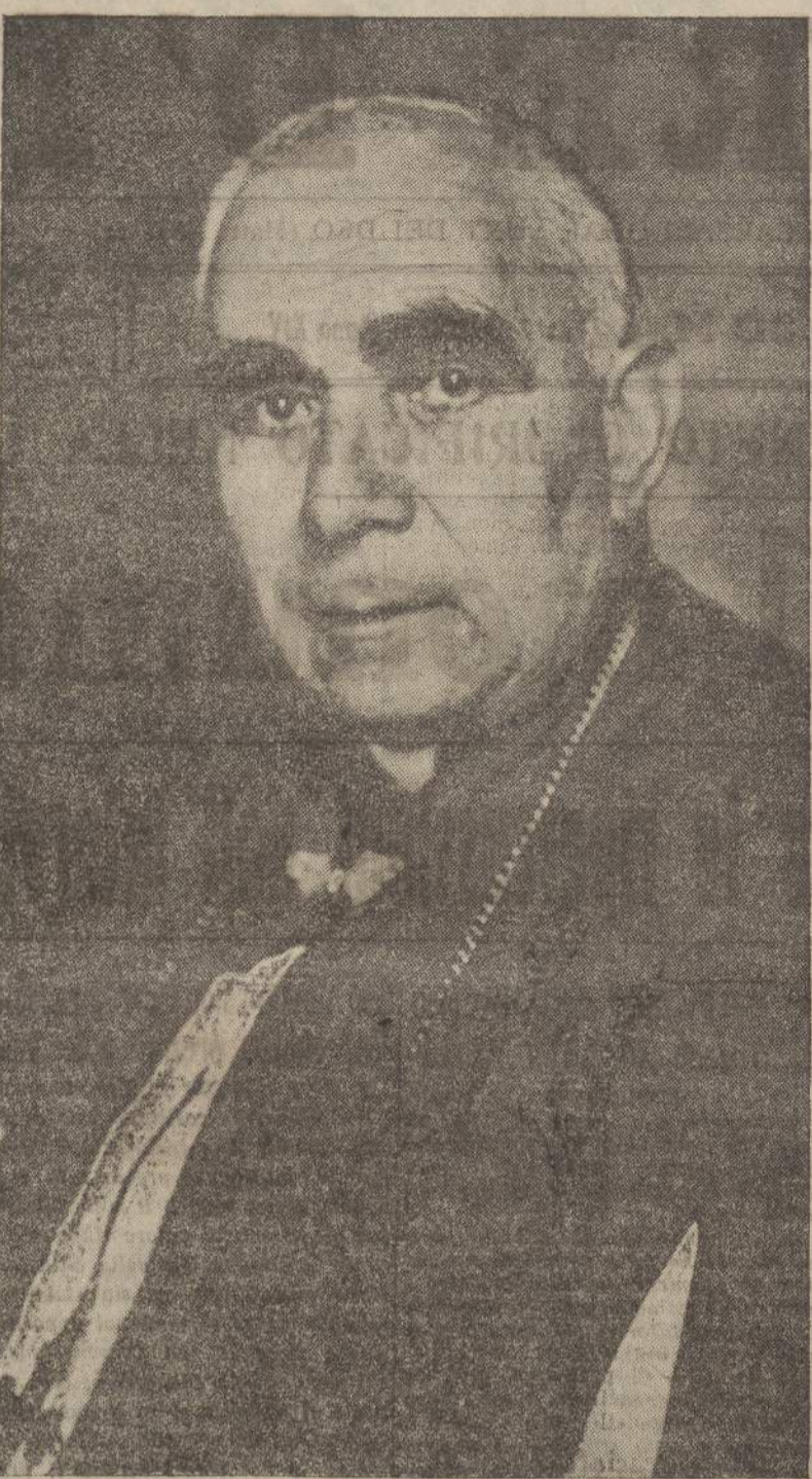
A. S. E. Mons. Callarossi, Vescovo di Feltre e Belluno, che festeggia in questi giorni il Giubileo episcopale tra la devota pia partecipazione di tutto il popolo, l'Avvenire d'Italia porge l'omaggio augurale più fervido e deferente.

GENOVA, 29. Ieri sera con una solenne cerimonia è stata imbarcata sul Conte Verde, destinata all'A. O., la statua di Nostra Signora della Guardia, che le autorità faranno giungere nel Tembien.