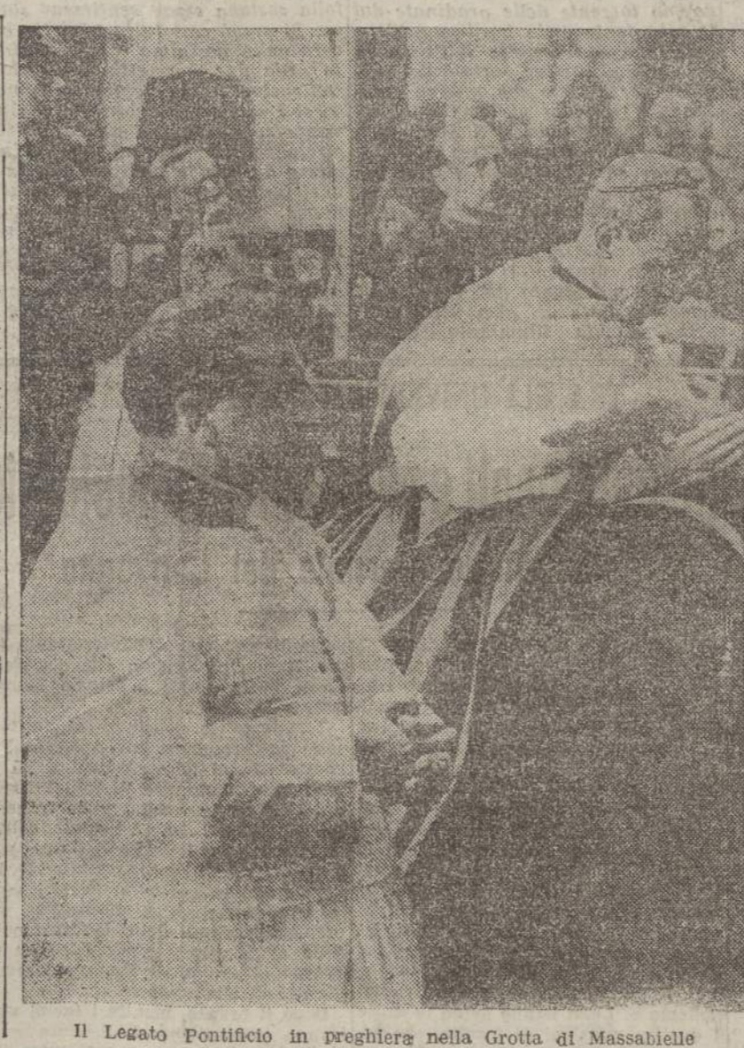
Il Legato Pontificio in preghiera nella Grotta di Massabielle

ROMA, 30. Il Foglio di disposizioni n. 2 del Segretario del P. N. F. N. 395 in data 30 aprile XIII reca: e il 7 maggio XIII alle ore dieci nella sede della federazione dei fasci di commercio di Vercelli sono convocati i Presidenti delle Confederazioni (agricoltori e lavoratori dell'agricol-