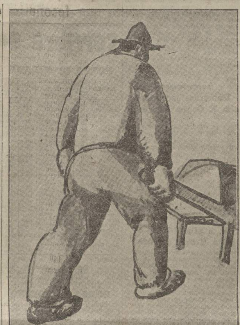
MARGOTTI ANACLETO: Operai. Quadro scelto da S.E. il Capo del Governo alla XIX Bienn. nei recenti acquisti

Idealmente allora il profano accosta alcuno di quei capolavori, costosi fitti uno a fianco dell'altro, della mostra retrospettiva, con questo o quest'altro che trova designato nella congerie dei padiglioni moderni e che l'hanno colpito per primi.