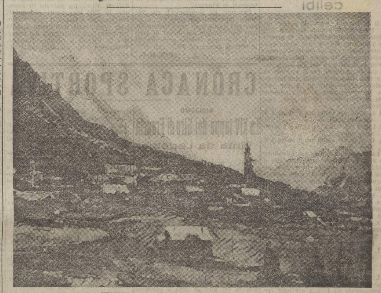
EUGENIO POLESSELLO - La Conca di Cortina

Polesello ha esposto a Roma tutta una serie di visioni del lago di Garda, fresche come acquarelli e di una tecnica solidissima, per farci sentire tutta la poesia di quelle Dolomiti dalle forme così straordinarie e così piene per noi di memorie.