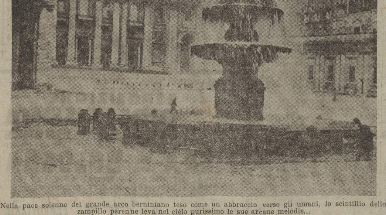
Nella pace solenne del grande arco berniniano teso come un abbraccio verso gli umani, lo scintillio dello zampillo perenne leva nel cielo purissimo le sue arcane melodie...

La Confederazione Nazionale dei Sindacati fascisti professionisti e artisti, indice fra gli artisti italiani iscritti ai Sindacati Belle Arti e regolarmente tesserati, un Concorso per il manifesto delle commemorazioni di Raffaello, Bramante, Leopardi e Rossetti, che avranno luogo nel periodo agosto-settembre p. v. nelle Marche, e denominato «Celebrazioni Marchigiane». Il manifesto, che avrà le dimensioni di un metro per sei metri, dovrà portare la seguente dizione: «Confederazione Nazionale Sindacati fascisti professionisti ed artisti Celebrazioni Marchigiane Agosto-Settembre 1934-XIX».