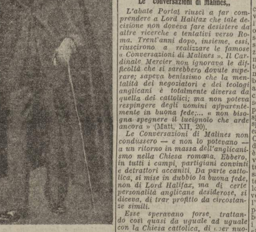
Lord Halifax, ambasciatore britannico a Roma, in un momento della sua permanenza in città.