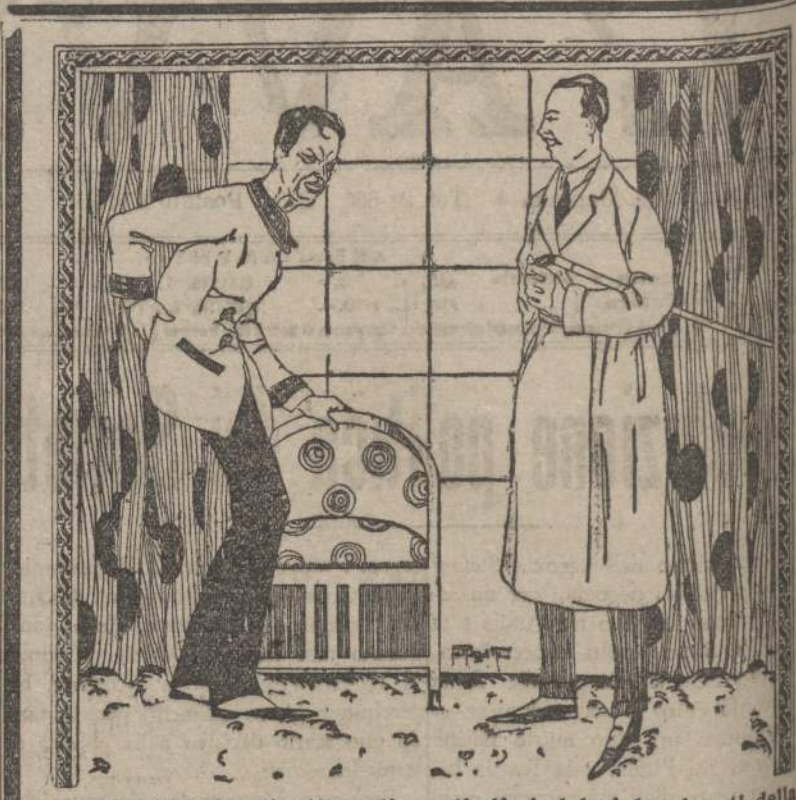
L'acido urico ti attanaglia e ti dà i dolori lancinanti della Lombaggine e del Reumatismo? Prendi le polveri per acqua da tavola mineralizzata

Leone Gessi - l'indimenticato "leone" - dedica un secondo volume alla piana e intelligente illustrazione della Città del Vaticano.