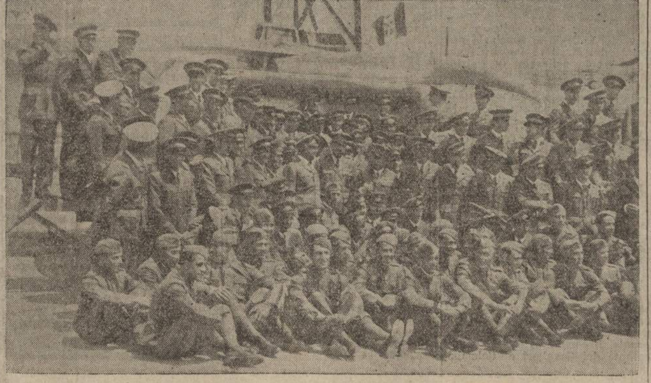
Un imponente corteo a Milano

Ora, in questo 1933, mentre Chicago - che sta divenendo uno dei centri più importanti di navigazione aerea, al servizio dei traffici e dei commerci - celebra il suo primo secolo di vita con una grandiosa esposizione, nelle acque azzurre