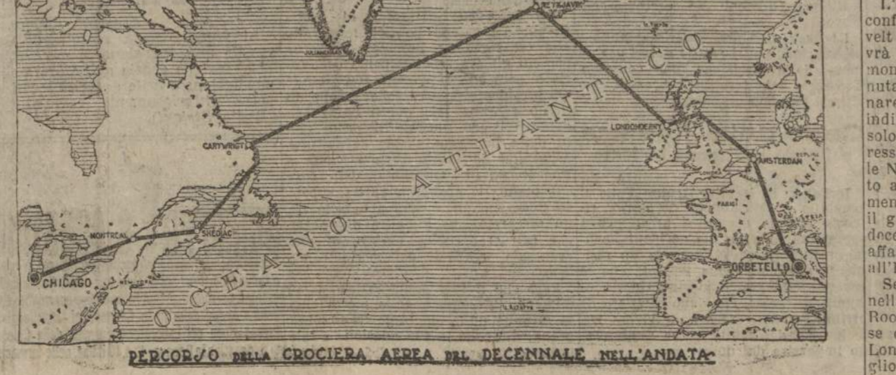
PERCORSO DELLA CROCIERA AEREA DEL DECENNALE NELL'ANDATA