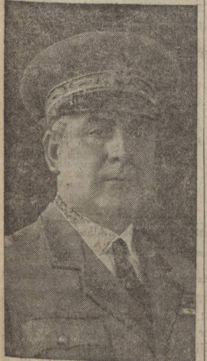
Il generale Pellegrini

REYKJAVIK, 5 luglio La seconda Squadra aerea atlantica, partita da Londonderry alle 13,15 (ora locale), ha sorvolato alle ore 18,5 (ora locale) le isole Vestman, presso la costa meridionale dell'Islanda. La Squadra ha poi felicemente ammarato alle 19,15 (ora locale) (Stefani).