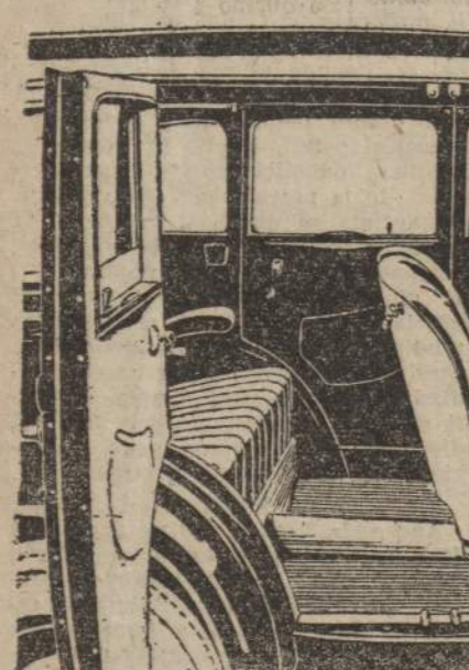
L'interno della berlina a 5 posti; si noti l'assenza del piantone centrale e la completa apertura delle portiere

La Fiat presenta al Salone di Milano 1933 - che s'inaugura con la Fiera il 13 aprile - una novità assoluta: una nuova « 4 cilindri » che prende il nome di « Ardita ».