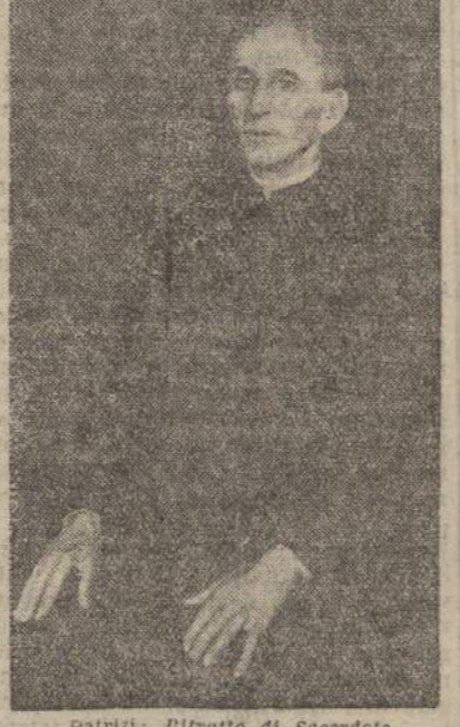
Patrizi. Ritratto di sacerdote

Hanno chiamato la esposizione Bezzelli-Patrizi. Mostra del ritratto, titolo un poco pesante e impegnativo specialmente ai giorni nostri quando si chiede forse all'artista di essere vagabondo e sgomitando troppo a un ritrattista.