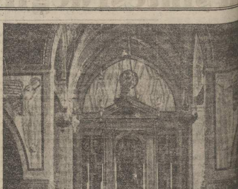
Basilica di Monte Berico