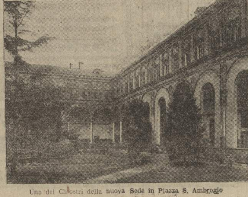
Uno dei Chioschi della nuova Sede in Piazza S. Ambrogio

Il bilancio degli stabilimenti Krupp è in perdita. ESSEN, 5 pom. Il bilancio degli stabilimenti Krupp per l'esercizio terminato il 30 settembre scorso presenta una perdita di 13.415.000 marchi.