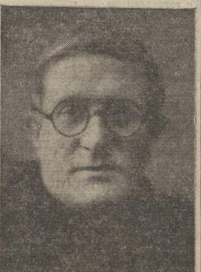
Il Rettore Magnifico Padre Agostino Gemelli o. f. m.